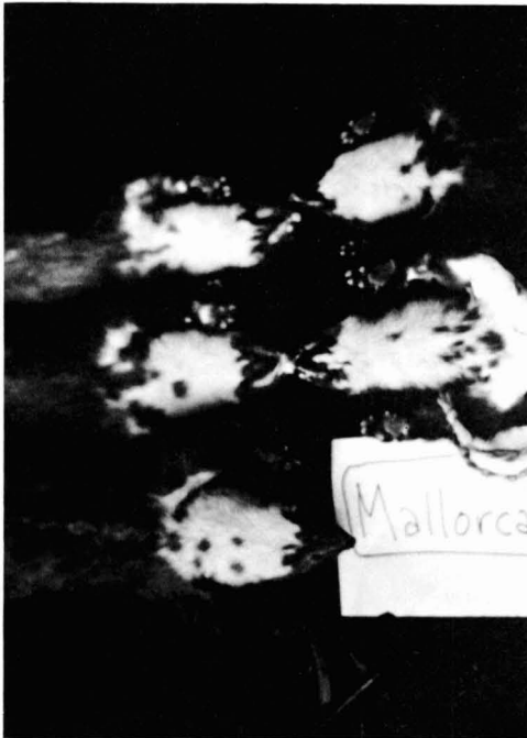
Fig. 2. Disseny de la taca pectoral a diversos exemplars de M. martes de Mallorca.

S'ha observat que existeix una gran variabilitat en la coloració de la taca de la gargamella dels exemplars mallorquins: tres exemplars presenten la taca de color taronja viu, cinc de color taronja pàl·lid, un de color blanc ataronjat i els altres dos blanc-crema/grog pàl·lid. Pel que fa a la forma de la taca, HUTTERER & GERAETS (1978) presenten un dibuix mostrant el disseny de la taca dels dos exemplars mallorquins que han estudiat. Aquests autors indiquen que les taques pectorals dels Marts mallorquins són petites i estretes. Les observacions realitzades no recol-