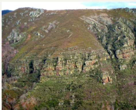
Sinclinal de O Courel.