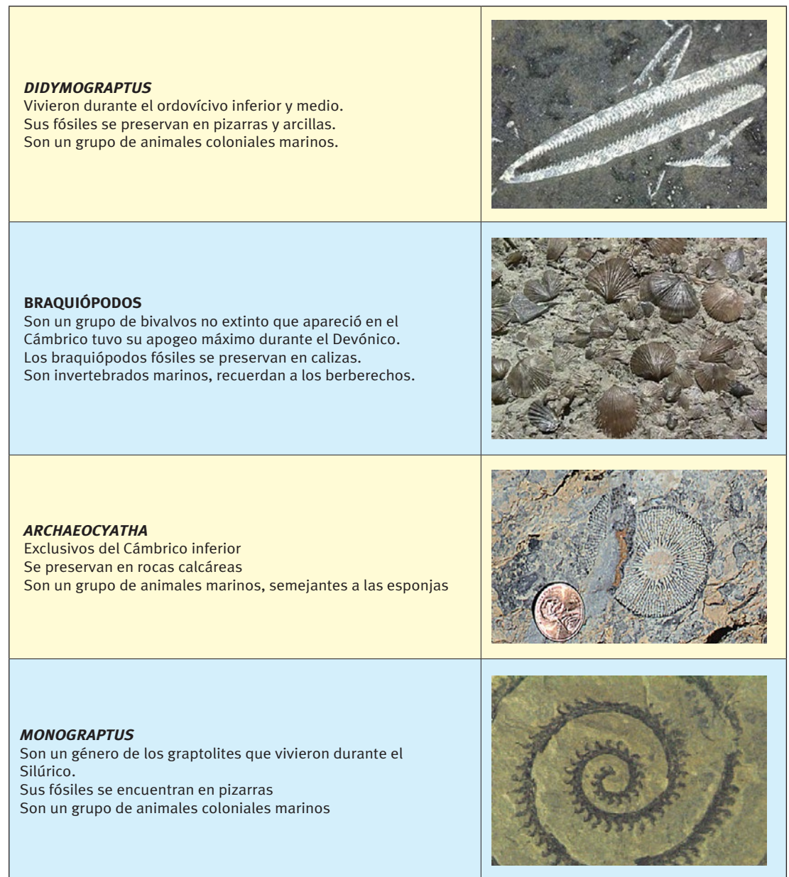
Fig. 5. Fichas, elaboradas para la tarea, con información de los fósiles encontrados en O Courel. Imágenes e información tomadas de la Encyclopaedia Britannica Online ( www.britannica.com ).

Devónico: predominan las calizas, donde se encontraron fósiles de braquiópodos.