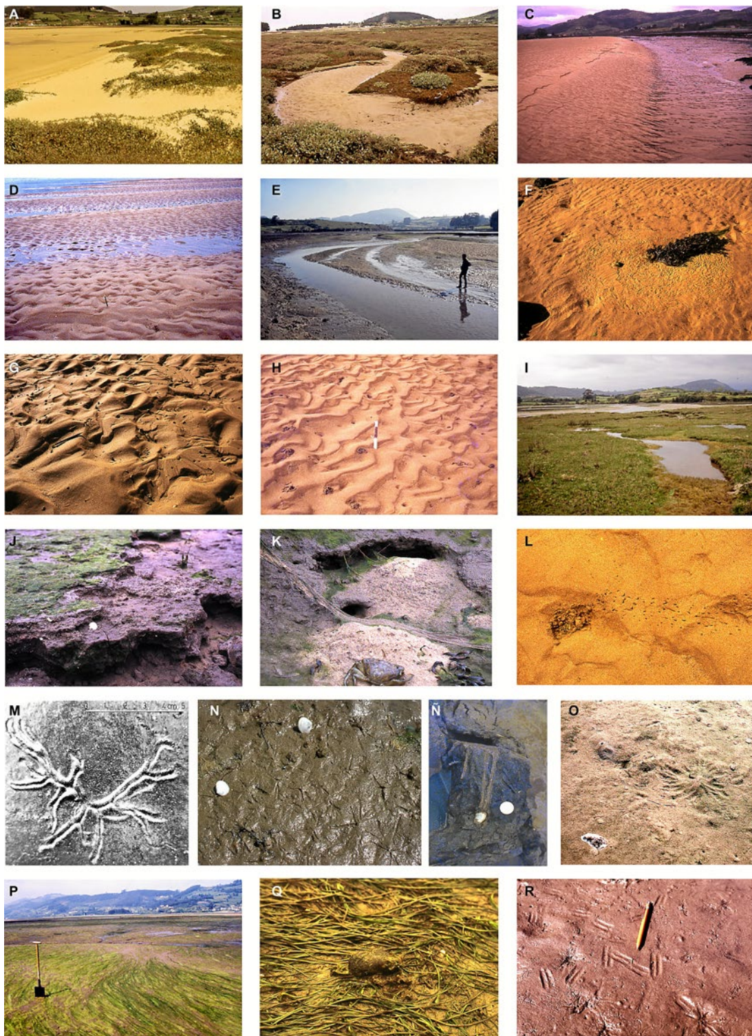
Fig. 3. A) Dunas estuarinas vegetadas con Halimione portulacoides . B) Canal mareal de trazado sinuoso, relleno por fondos de arena. C) Transversal del canal secundario con el margen izquierdo desarrollando marcas de arroyada. D) Ondas de arena y ripples de corriente del arco distal del delta mareal. E) Barras de meandro en un canal mareal. F) Marcas de arrastre por un alga en una llanura arenosas; al fondo ripples de oscilación. G) Anélidos tubícolas sobre un lecho de canal y ripples linguoides. H) Campo de Arenicola marina con ripples transversales, que pasan a crescénticos. I) Charcas mareales en la marisma. J) Hiladas de Hydrobia ulvae en facies fangosas culminadas por Enteromorpha sp. K) Galería excavada por el cangrejo Carcinus maenas y un ejemplar abajo. L) Rastros de locomoción de un cangrejo que se ha enterrado en la arena. M) Marca superficial dendrítica del anélido Nereis diversicolor . N) Marcas estrelladas superficiales y dos ejemplares del bivalvo Scrobicularia plana . Ñ) Detalle del mismo en posición de vida con los rastros de los sifones. O) Montículo estrellado producido por una serie de peces mugílidos al depredar una pieza. P) Llanura de Enteromorpha sp., alineada por la corriente. Q) Zostera noltii con un Modiolus sp. fijado. R) Marcas de aletas ventrales de góbidos y blénidos sobre un fondo fangoso.

dejando marcas de arrastre que indican la direccionalidad de la corriente. También ante la presencia de obstáculos, como conchas y fragmentos vegetales, los flujos de agua generan marcas crescénticas que permiten deducir el sentido de la corriente.