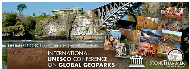
Fig. 6. Los Geoparques son figuras auspiciadas por la Organización de las Naciones Unidas para la Educación, la Ciencia y la Cultura (UNESCO) aunque, por ahora, no tienen la categoría oficial de la que disfrutaban otros programas propios de este organismo, como el denominado Patrimonio de la Humanidad.

Fig. 5. Logo de Grupo de trabajo portugués, perteneciente a la Asociación Europea para la Conservación del Patrimonio Geológico (ProGEO).