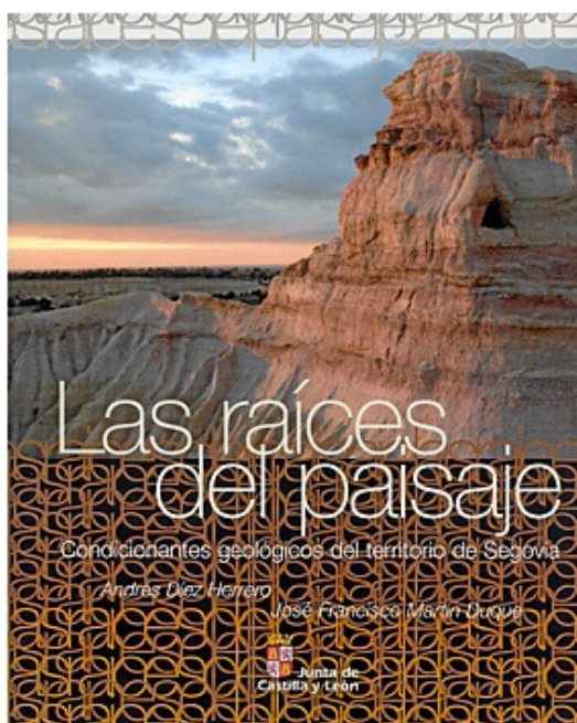
Fig. 7. Portada del libro Las raíces del paisaje , un manual de lectura imprescindible para reconocer las raíces geológicas de muchos de nuestros paisajes.