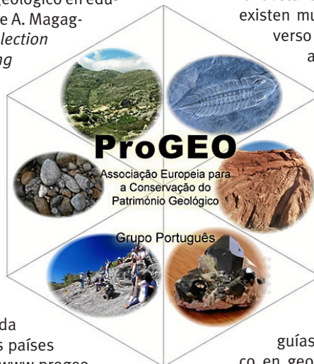
Fig. 5. Logo de Grupo de trabajo portugués, perteneciente a la Asociación Europea para la Conservación del Patrimonio Geológico (ProGEO).

Fig. 4. Captura de pantalla de la web de Natural England, una entidad pública dedicada a conservar el medio ambiente. Una de las bases del trabajo realizado en Natural England se centra en la concienciación de la población, como se aprecia en este Countryside Code, un código de conducta destinado a respetar, proteger y disfrutar del mundo rural.