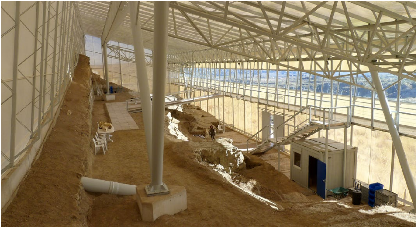
Fig. 4. Aspecto provisional (hasta la musealización) del interior del Centro paleontológico Fonelas P-1.

forma, las excelentes condiciones de observación del paisaje desde el yacimiento de Fonelas P-1 permiten ampliar formidablemente el contenido divulgativo y considerar la evolución geológica y paisajística de la comarca, constituyendo un ejemplo muy atractivo para comprender los procesos de relleno de una cuenca continental y su posterior vaciado, erosión y puesta al descubierto de antiguas capas fosilíferas. En definitiva, permite una fácil y atractiva transmisión a la sociedad de la geología de la comarca, un recurso turístico y socio-cultural indiscutible en este territorio.