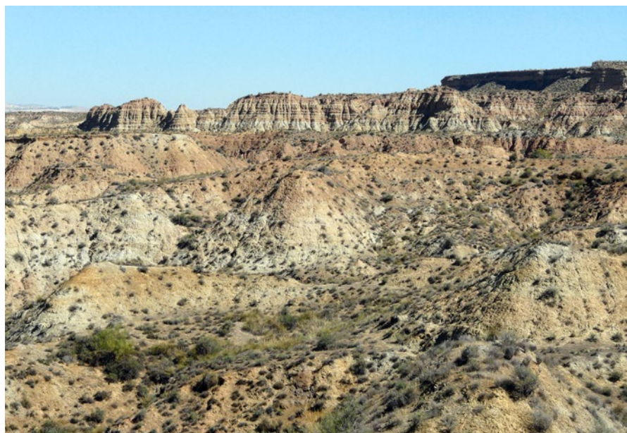
Fig. 1. Detalle del paisaje actual de la cuenca de Guadix en el término municipal de Fonelas (Granada). Las unidades expuestas en las cárcavas corresponden a parte del relleno sedimentario del Pleistoceno inferior.

El yacimiento de Fonelas P-1, enclavado a 2,5 kilómetros del municipio que le da nombre, constituye hoy día uno de los referentes paleontológicos en el Viejo Mundo sobre los grandes mamíferos que vivieron en Europa durante el Pleistoceno inferior basal (hace 2 millones de años). Su excelente registro fósil ha permitido cambiar la idea que se tenía sobre este momento del pasado y aportar valiosa información sobre