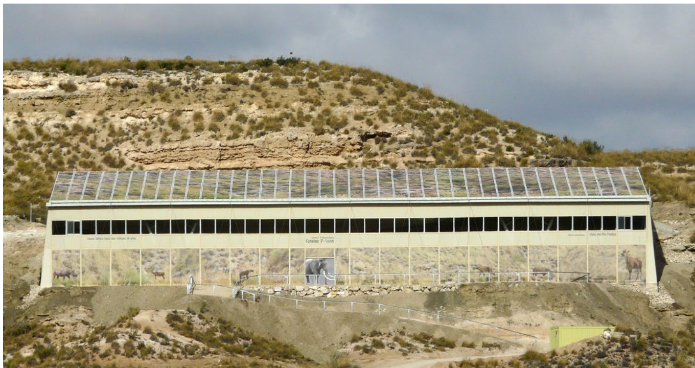
Fig. 3. Vista frontal del Centro paleontológico Fonelas P-1, que constituye la primera fase en campo de la Estación paleontológica Valle del Río Fardes del IGME en Fonelas (Granada). Esta infraestructura, de 1.020 m 2 de superficie, que protege parte importante del yacimiento paleontológico, ha sido finalizada en noviembre de 2013, se dotará de contenidos en enero-febrero de 2014 y se prevé la apertura al público en Semana Santa de 2014.

energía, hacia el antiguo río Fardes (Paleofardes). Estos huesos, aportados al lugar por los miembros de un clan de hiénidos, fueron progresivamente cubiertos por el sedimento procedente del propio pisoteo del terreno producido por los hiénidos (unidad fosilífera biogénica) y por la generación de pequeños charcos producidos por agua de lluvia y, por tanto, sellados por sedimentos limosos y arcillosos de grano muy fino. El yacimiento conserva por tanto una paleosuperficie de hace dos millones de años sobre la que habitaron los hiénidos de la especie Pachycrocuta brevirostris y en la que acumularon los huesos de los animales de los que se alimentaron. En definitiva, la asociación faunística de Fonelas P-1 puede ser considerada como testimonio de un “Hotspot” paleobiológico en el inicio del Cuaternario, asociado a un momento climático con abundancia de recursos hídricos superficiales.