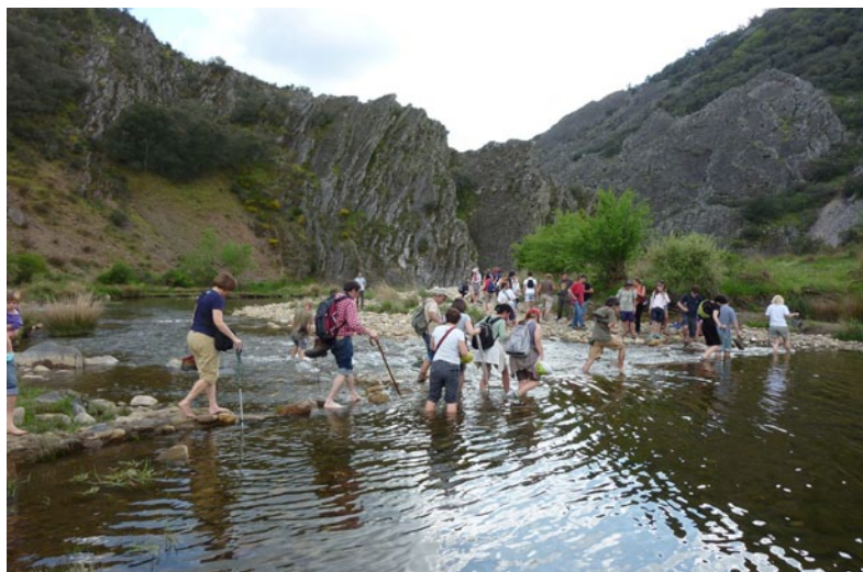
Fig. 8. Los asistentes de Geología 10 – Ciudad Real no dudaron en cruzar el río para acercarse a los afloramientos.

Consideramos que la difusión en los medios de comunicación es una parte muy importante de Geología . No se trata solamente de que los asistentes a las excursiones disfruten y aprendan geología,