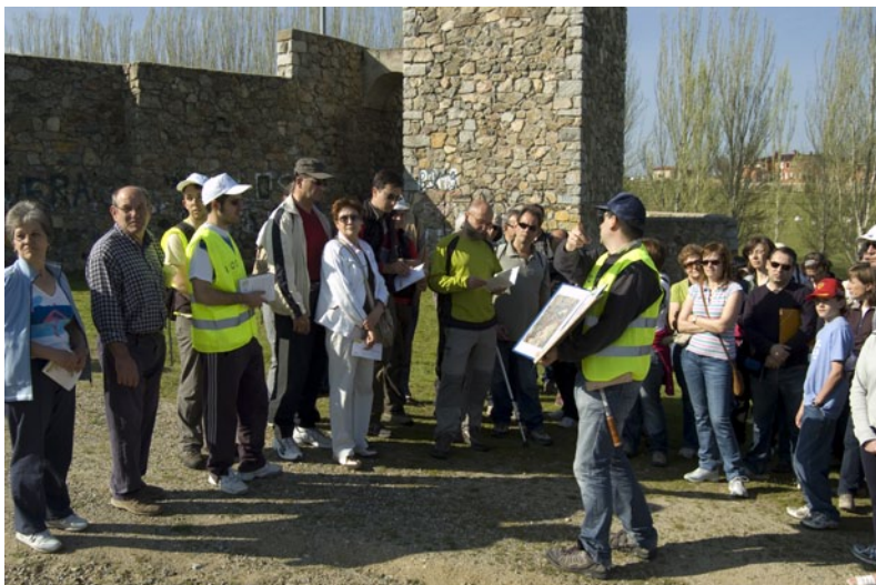
Fig. 7. Asistentes a Geolodía 10 – Segovia atendiendo a unas explicaciones que se apoyan en esquemas preparados anteriormente.

asistentes y horarios es el de los monitores en las paradas con grupos de asistentes que van pasando por las mismas, a lo largo de un recorrido que se hace andando. El problema es que este tipo de excursión requiere como mínimo unas diez personas para su organización, ya que hace falta una persona que organice los grupos al principio del recorrido, geólogos en las paradas, y monitores que acompañen los grupos para que éstos no se pierdan. En cambio, el más cómodo para los organizadores es un recorrido con autobús llevado por uno o dos geólogos, con paradas en sitios determinados. La ventaja sobre el tipo de excursión anterior es que el público está muy controlado; las desventajas, el coste y la obligada limitación de asistencia.