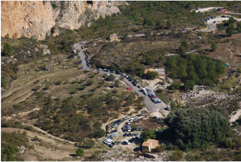
Fig. 5 (izquierda). Filas de coches aparcados en el Geolodía 09 – Alicante de la Sierra Aitana, al que asistieron 800 personas.