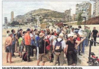
Los participantes atienden a las explicaciones en la plaza de la Albuñol.

El pasado domingo 23 de abril tuvo lugar la tercera edición de Geología 10, una iniciativa promovida desde el Departamento de Ciencias de la Tierra de la Universidad de Alicante (UA) para dar a conocer las características físicas del territorio de la provincia de una manera sencilla y accesible para todos los públicos. Este encuentro divulgativo con el patrimonio geológico se desarrolló en la ciudad de Alicante y contó con la asistencia de unas 1.000 personas, según la organización. De esta forma, se superó la participación de las dos ediciones anteriores, que se habían llevado a cabo en la Sierra Helada y la Sierra de Albuñol.