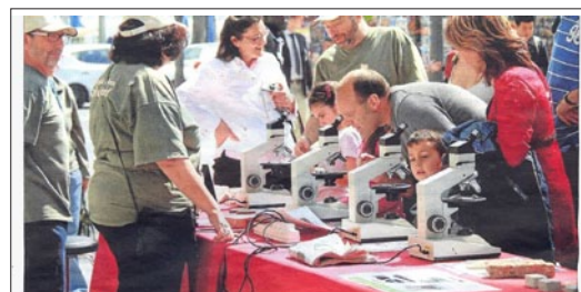
Explicaciones prácticas de geología al final del recorrido celebrado este domingo, en la Explanada.

Por lo tanto, es recomendable preparar cuidadosamente un dossier de prensa y comunicación, que consta de dos partes. La primera, común a todas las excursiones, especifica lo que es un Geología , su origen, lo que se pretende con una acción de divulgación de este tipo, así como el programa general de Geología 11 . A su vez, cada uno de los organizadores y su equipo añadirá una segunda parte descriptiva de la excursión de su provincia y se encargará de hacerlo llegar a los medios de comunicación locales y provinciales, a través de los gabinetes de comunicación que tengan a su alcance. Por ejemplo, el diario Ideal se hizo eco de Geología 10 – Granada (Figura 10), con un titular llamativo.