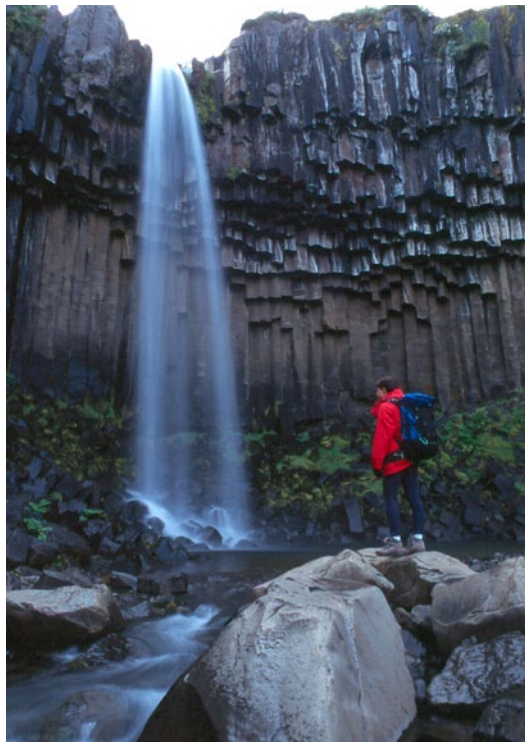
Fig.2. Algunos países como Islandia, centra gran parte de sus ofertas turísticas en la existencia de rasgos geológicos notables, que actúan como focos turísticos.

24 parques naturales de Andalucía. Pero el ejemplo más significativo es el Parque Nacional del Teide (Canarias), espacio natural protegido por su gran relevancia ambiental y su protagonismo geológico, que con tres millones y medio de visitantes en 2006 fue más visitado que cualquier monumento español, superando incluso los valores de los museos del Prado (Madrid) y Guggenheim (Bilbao) juntos. En el panorama internacional, algunos ejemplos son los 520.000 visitantes anuales de la Calzada de los Gigantes (Irlanda), los más de dos millones de visitantes de la Mammoth Cave (USA), o los 4.200.000 visitantes anuales del Parque Nacional del Gran Cañón (EEUU). Incluso algunos países basan buena parte de su estrategia de desarrollo y promoción en la existencia de elementos geológicos singulares entre otros aspectos naturales y culturales, como Islandia, Nueva Zelanda, Argentina o Nepal.