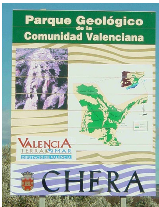
Fig.16. Cartel indicador del Parque Geológico de Chera, en Valencia, uno de los primeros creados en España.

Existen numerosos trabajos sobre geoturismo urbano y divulgación de la geología en las ciudades. Algunos superan en sus planteamientos los