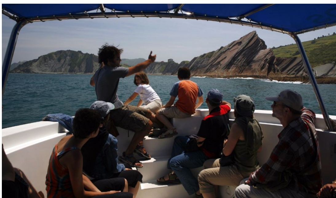
Fig.4. Visita geológica guiada en barco, ofrecida entre las localidades de Deba y Zumaya como un recurso turístico mas de la zona.

Existen diversas definiciones publicadas del término geoturismo, cada una de las cuales introduce matices interesantes. La primera definición de geoturismo apareció en una revista como “la provisión de recursos interpretativos y servicios para promocionar el valor y beneficio social de los lugares de interés geológico y geomorfológico, y asegurar su preservación y su uso por parte de estudiantes, turistas u otro tipo de visitantes” (Hose, 1995). Una definición similar es la proporcionada por Dowling y Newsome (2006), quienes afirman que “el geoturismo es un turismo sostenible cuyo objetivo principal se centra en experimentar los rasgos geológicos bajo un entendimiento cultural y medioambiental apreciando su conservación, y que es locamente beneficioso”. Ruchkys