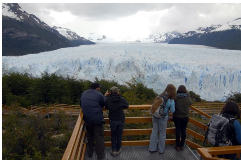
Fig. 7. Glaciar Perito Moreno, Argentina, un enclave de atracción turística internacionalmente conocido, pero donde no se proporciona información acerca del origen y funcionamiento del glaciar.