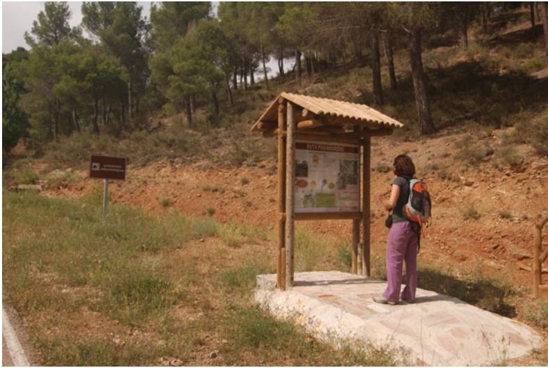
Fig.9. Yacimiento de Murero (Zaragoza), acondicionado con paneles y pasarelas y facilitan la visita.