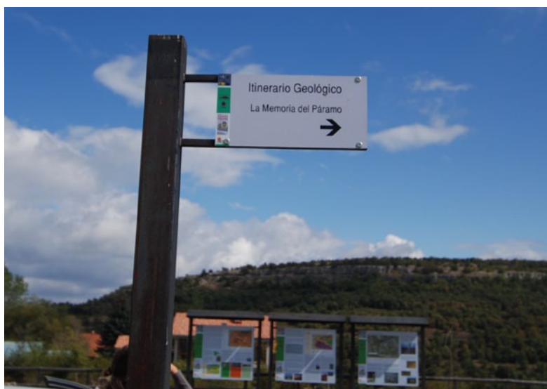
Fig.13. Señal indicando la existencia de un itinerario geológico en Las Loras, Burgos, equipados por paneles y apoyados por una guía geológica (Basconillos et al., 2007).