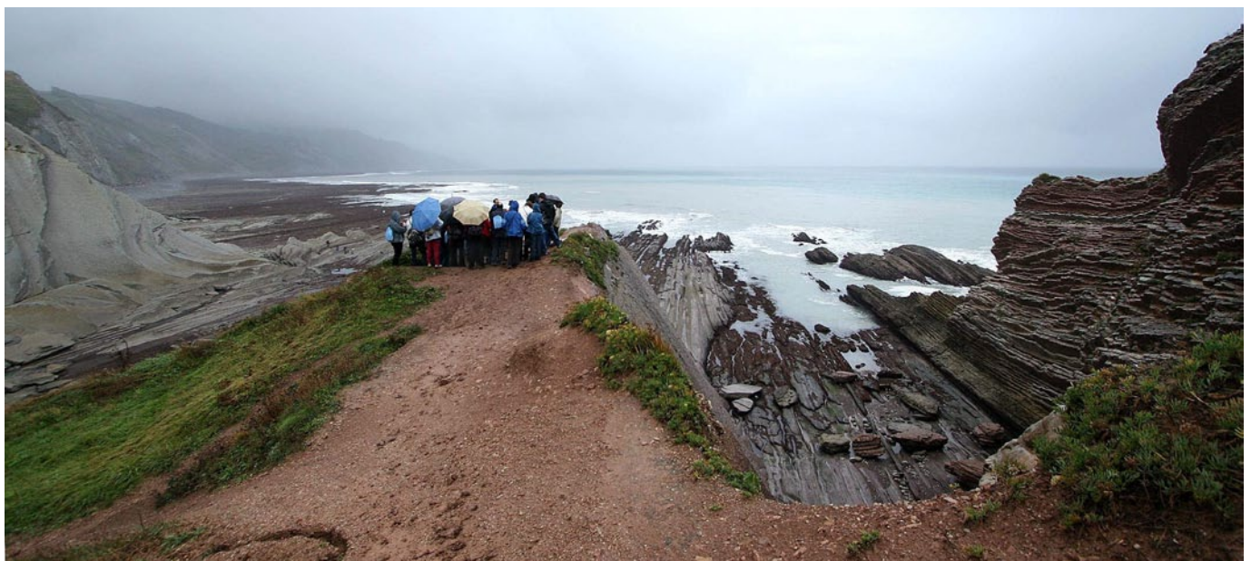
Fig.15. Visita guiada al Biotopo del Litoral Deba-Zumaya, incluido en el Geoparque de Costa Vasca, declarado en 2010.

actualmente evaluados para determinar su posible ingreso en la Red Europea.