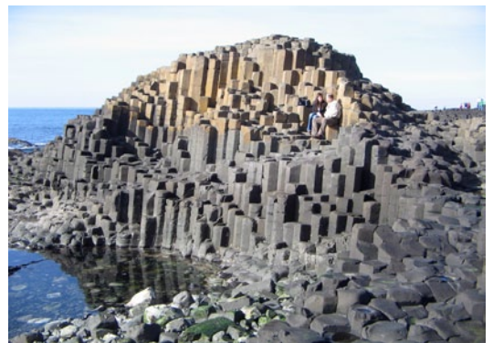
Fig 3. La Calzada de los Gigantes, Irlanda, afloramiento geológico declarado Patrimonio de la Humanidad y que recibe al año mas de medio millón de visitantes. Fotografía: Asier Hilario.

Estos datos confirman que el turismo geológico es una realidad. Pero como más adelante se describirá, es una realidad que se ejerce en la mayoría de los casos de manera inconsciente o involuntaria y se le han asignado otros nombres como ecoturismo o turismo natural, pero la naturaleza clara y eminentemente geológica de los recursos visitados ha propiciado que se extienda el término geoturismo como caso concreto de ellos. Una buena muestra de este tipo de turismo es la iniciativa de la declaración de Geoparques, originalmente europea pero actualmente extendida a nivel mundial bajo los auspicios de la UNESCO, que ponen de manifiesto cómo los componentes geológicos del territorio pueden ser un poderoso reclamo para atraer visitantes y, a la vez, ser utilizado como eje en la creación de programas de desarrollo local y regional (Zouros y Martini, 2001).