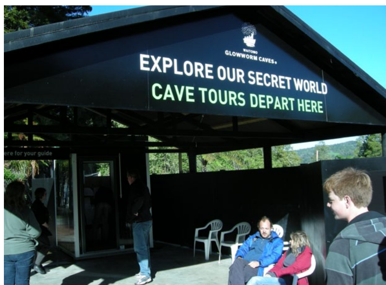
Fig.5. Las cuevas turísticas y, en general, las manifestaciones kársticas tienen un gran poder de atracción turística. En la imagen la entrada a la cueva Waitomo, en Nueva Zelanda, que recibe al año 250.000 visitantes a pesar de su remota ubicación.

En geoturismo, como en cualquier modalidad de turismo, es necesario proporcionar recursos turísticos y, en la mayoría de los casos, construir infraestructuras. El geoturismo puede enfocarse como complemento al turismo convencional masivo (Villalobos, 2001), ofreciendo nuevas opciones a zonas aledañas a grandes focos de interés diversificando su oferta y el reparto de beneficios económicos y sociales. Además, y aunque algunos aspectos ya ha sido citados anteriormente, debe estar centrado en los elementos geológicos, ya sean formas o procesos; y debe estar planificado y debe ser localmente beneficioso en términos socioambientales y económicos (Dowling, 2009). Así que una verdadera oferta geoturística debe referirse al interés de los lugares de interés geológico (LIGs), pero también a asegurar los servicios turísticos habituales: 1-de alojamiento; 2-de alimentación; 3-de intermediación (prestación de cualesquiera servicios turísticos susceptibles de ser demandados por los usuarios de servicios turísticos); 4-de información, 5-de guías-intérprete, y, en algunos casos, 6-de acogida (eventos, convenciones, etc.).