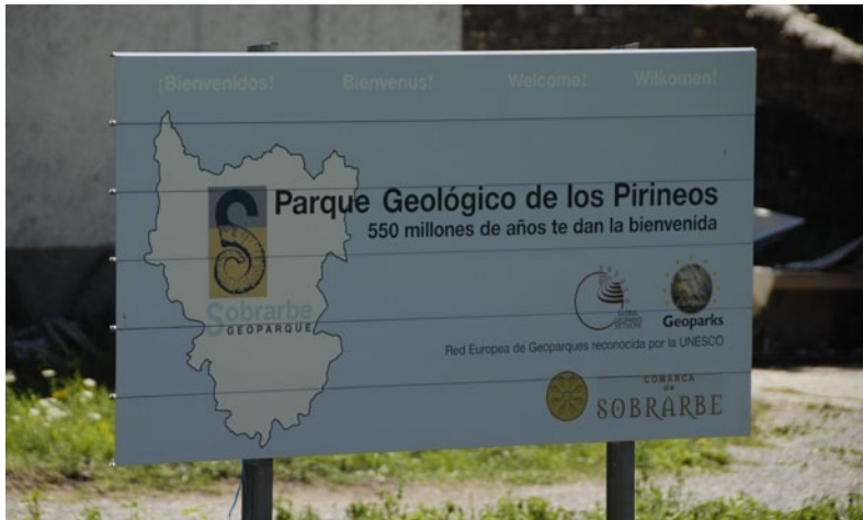
Fig.14. Cartel de bienvenida al Geoparque de Sobrarbe (Huesca), uno de los cinco geoparques españoles.

de interpretación del parque natural de Valderejo (Álava), o el de Olot que complementa la visita a la zona volcánica de la Garrotxa (Girona), entre muchos otros ejemplos.