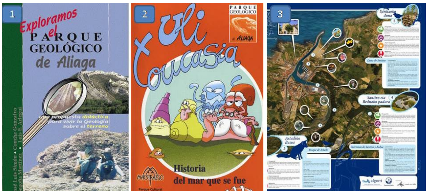
Fig. 6. Ejemplos de materiales didácticos (portadas de publicaciones y póster) elaborados para diferentes edades. Se encuentran disponibles en los centros de interpretación del Geoparque del Maestrazgo (1) y (2) y de la Costa Vasca (3).

La estrategia más habitual de los geoparques combina actividades anteriores a la salida de campo, durante la salida y posteriores a ella, de acuerdo con Brusi (1992) y la web Geocamp (Obrador, 2004). Ésta es la estructura que propone, por ejemplo, la carpeta didáctica y el CD interactivo publicado por el Parque Geológico de Aliaga (Geoparque del Maestrazgo) para alumnos y profesores de educación secundaria (Simón et al., 2003). A continuación se describen de forma más extensa dos programas combinados que se llevan a término desde el curso 2007/2008 en el Geopark Naturtejo (Portugal).