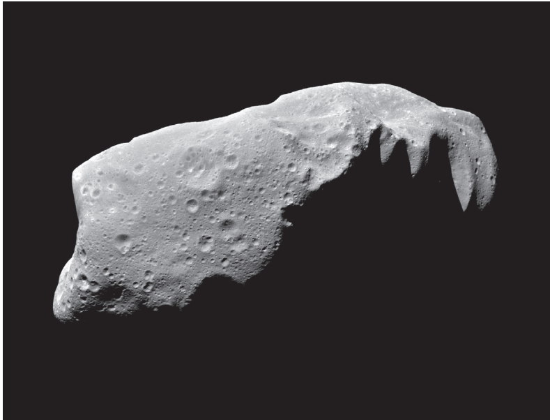
Fig. 3. También los asteroides, como Ida , tienen su superficie craterizada.

asteroides (figura 3). Venus, más difícil de auscultar por su densa atmósfera, los tiene igualmente (figura 4) aunque, como en la Tierra, su número es mucho menor porque su actividad geológica borra las huellas de los impactos.