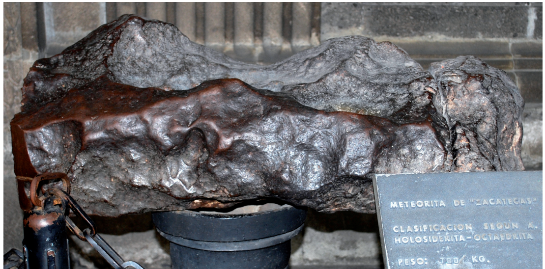
Fig. 5. Siderita de 780 kilos hallada en Zacatecas (Méjico).

como permita el sistema y hayan sobrevivido a los sucesos locales.