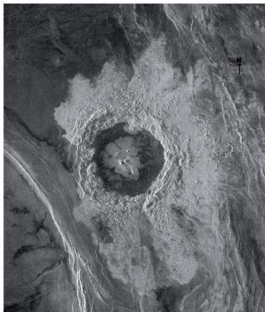
Fig. 4. Venus. Cráter Dickinson de unos 69 km de diámetro tomada por la misión Magallanes. La distribución de eyectas sugiere un impacto oblicuo procedente del oeste.

En definitiva, en nuestro sistema solar todo aquel objeto celeste que puede tener cráteres de impacto los tiene. Una regularidad como esta no puede ser casual sino que debe haber una causa que la explique. En este caso, la comunidad científica no parece albergar dudas, los cráteres de impacto son huellas de sucesos que debieron ser especialmente frecuentes en los inicios de la configuración del sistema solar y nos hablan de un proceso que resultó clave en la génesis planetaria, la acreción. De manera que cualquier teoría que pretenda explicar el origen de nuestro planeta o del sistema solar debe otorgar un papel fundamental a la acreción.