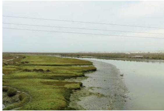
Fig. 1. Izquierda: playa arenosa afectada fundamentalmente por los procesos erosivos y sedimentarios asociados al oleaje (playa de Caños de Meca, Cádiz). Derecha: marisma fangosa afectada fundamentalmente por los procesos sedimentarios asociados a las mareas (marismas de la Bahía de Cádiz).

mareales, como llanuras de marea, marismas, etc., como es el caso de las costas atlánticas españolas. Los sedimentos acumulados en las zonas protegidas ( lagoons , estuarios, etc.) son de granulometría fina (limo, arcilla), debido a la menor energía. La sedimentación tiene lugar cuando el flujo de las corrientes mareales alcanza un valor mínimo; esto sucede básicamente cada vez que el nivel del mar alcanza su máximo (pleamar, con depósito en la llanura supramareal). El resultado de todo este proceso es una progresiva colmatación de todos estos cuerpos de agua semicerrados.