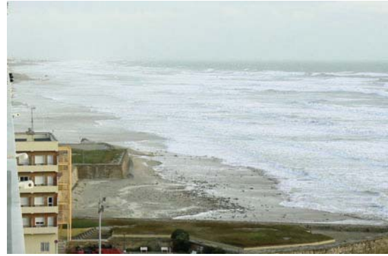
Fig. 2: Aspecto de una playa en situación de buen tiempo (izq.) y durante un temporal (dcha.). La sobreelevación del nivel del mar asociada al temporal favorece una mayor penetración del oleaje sobre la playa.

temperatura de la superficie marina es elevada (> 27°C). Pierden fuerza rápidamente sobre las masas continentales o sobre zonas donde el agua superficial presenta una menor temperatura.