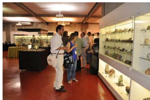
Cóctel de apertura. Museo de Mineralogía. Instituto de Geociências–USP.