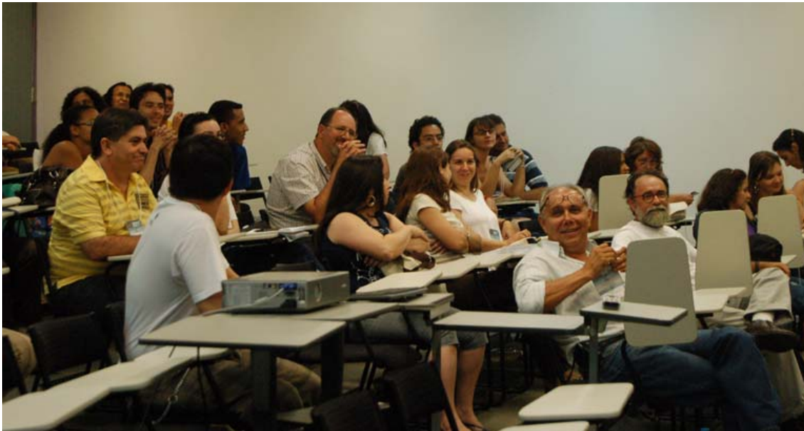
Sesión de presentación oral de los trabajos.

profesores de Ciencias de la Tierra presentó el curso de profesorado para Ciencias de la Tierra de USP. En esta sesión se pudieron discutir diferentes propuestas para formar profesores de Ciencias Naturales con más contenido geológico. Fue señalada la inexistencia de asignatura específica de Ciencias de la Tierra en la educación básica obligatoria (en Brasil la enseñanza obligatoria es de las 6 a los 17 años de edad) y los problemas profesionales de los profesores formados por esos cursos.