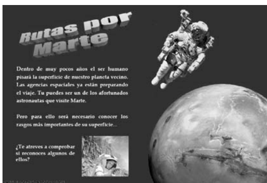
Fig. 5. Un programa de ordenador nos permite hacer rutas virtuales por la superficie marciana, reconociendo sus rasgos morfológicos más destacados.