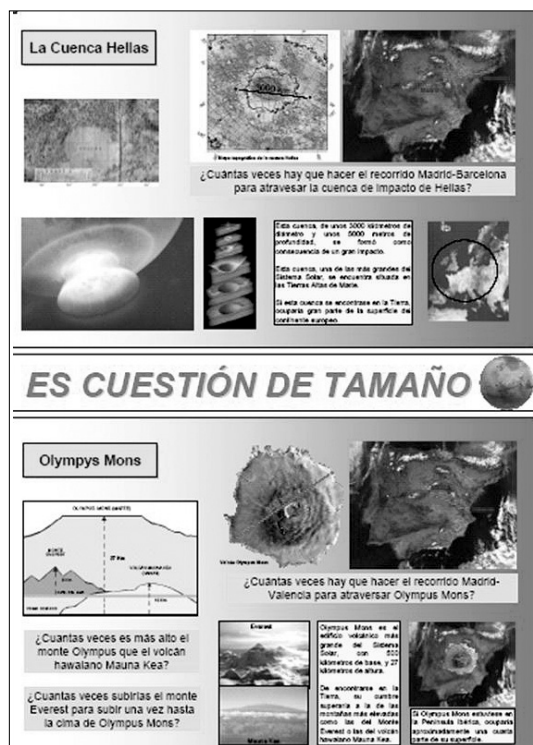
Fig. 1. La cuenca de impacto Hellas, de 3.000 km de diámetro y 5.000 m de profundidad, y el edificio volcánico de Olympus Mons de 500 km de base y 27 km de altura, sorprenden por sus tamaños si los comparamos con dimensiones geográficas conocidas en la Tierra.

Marte dispone de relieves de extraordinarias dimensiones en comparación con los relieves de nuestro planeta. Sólo hay que recordar los 7.000 Km de longitud de Valle Marineris, o los 27 Km de altura de Olympus Mons, el cañón más largo y el volcán más alto de todo el Sistema Solar (Figura 1). En esta ocasión, el profesorado puede hacer sus cál-