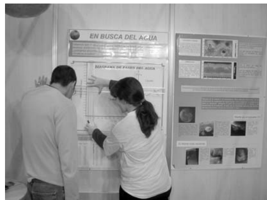
Fig. 4. La combinación de unos pocos datos: topográficos y de la temperatura de la atmósfera de Marte, nos permiten elaborar hipótesis sobre la posibilidad de encontrar agua líquida estable en la superficie de este planeta.