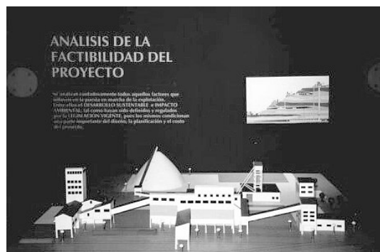
Figura 5. Maqueta que representa una planta de concentración de un depósito diseminado del tipo cobre porfirico como es el caso de la mina Bajo de La Alumbrera.

• Procesos y Transformaciones: del yacimiento al consumidor . Este módulo de la exposición nos