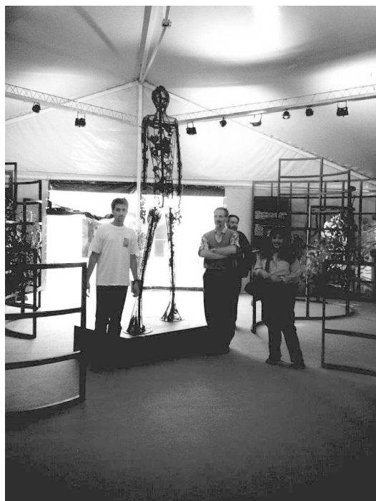
Figura 2. Entrada a la exposición.

Un grupo de alumnos estudiantes del último año de la Licenciatura en Geología de la Facultad de Ciencias Exactas y Naturales, se encontraba permanentemente a disposición de los visitantes para facilitar la manipulación de los objetos o ampliar la explicación de cualquier tema. La inclusión de este grupo en la estructura de la muestra causó un im-