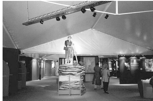
Figura 4. Vista general del módulo "Sobre la búsqueda de yacimientos". Sobre la derecha se observan mapas cartográficos y geológicos, fotografías aéreas y otros elementos relevantes para la prospección.

• Evaluación de yacimientos . La presencia de un mineral o asociación de minerales de interés económico no basta para asegurar el negocio minero, es necesario realizar una serie de estudios, cada vez más detallados para conocer la cantidad de mineral de que se dispone, cuánto costará su extrac-