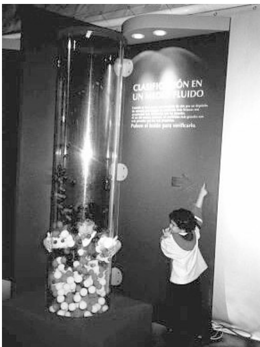
Figura 6. Actividad que muestra el método de separación en un medio fluido.

En forma complementaria a la instalación física de la exposición se preparó e instaló una página web a la que se podía acceder desde numerosas unidades distribuidas en diversos sectores de la mues-