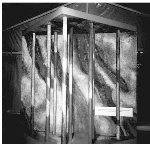
Figura 8. Caracterización de testigos de perforación atravesando en este caso un depósito de vetas.