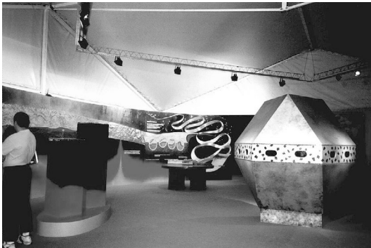
Figura 3. Vista panorámica del módulo 2. Se observa el diorama, donde se visualiza la estructura de la Tierra y la escala de tiempo geológico, la mesa de actividades para ejemplificar las fallas y el módulo para observar minerales fluorescentes.

• Estructura y materiales de la Tierra y la corteza terrestre , en este módulo se presenta la configuración del Planeta Tierra, la estructura de su capa más externa (la litosfera) y sus características más relevantes, así como la composición y propiedades físicas de los minerales y rocas que la componen (Fig. 3). Se hace hincapié en aquellas estructuras que se asocian a los yacimientos minerales y en aquellas propiedades que son utilizadas para la identificación de los diferentes minerales, como así también para su búsqueda o prospección.