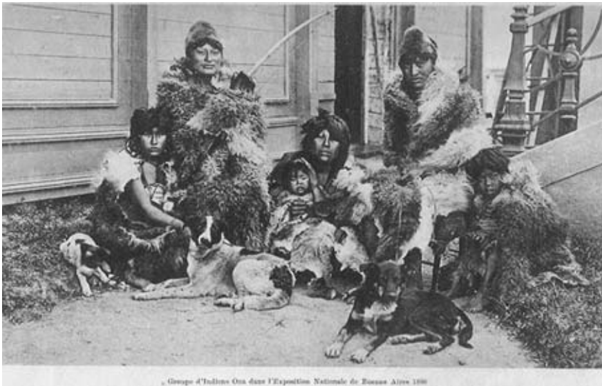
Figura 5. Grupo de indios onas enviados dentro de la Exposición Nacional de Buenos Aires 1898.

La atracción era el tableau vivant que estas familias arrojaban, remontando al público a tiempos prehistóricos 31 (Figura 5).