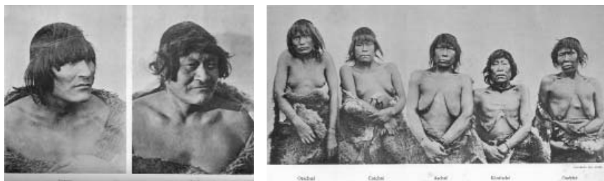
Figura 4. Lámina número 5 de Fernando Lahille (1896) y Pedro Godoy. Fuente: Lahille, Fernand. Matériaux pour servir à l'histoire des onas. Indigènes de la Terre de Feu. Revista del Museo de La Plata. 1926; 29: 339-361.

Bajo el principio de estandarización en pos de la clasificación fenotípico/racial, las fotografías antropológicas solicitadas y hechas por antropólogos, iban en general acompañadas por minuciosas tablas antropométricas donde figuraban las medidas absolutas y las medidas relativas 27 .