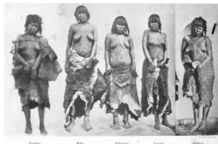
Figura 3. Lámina número 3 de Fernando Lahille (1896) y Pedro Godoy.