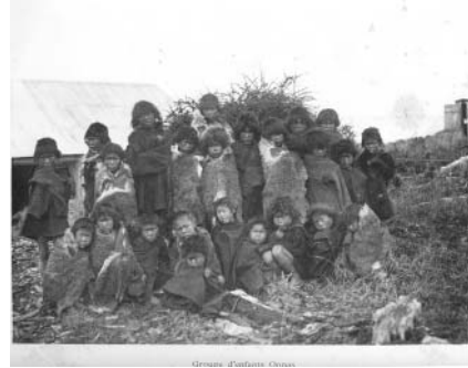
Figura 2. Lámina número 2 de Fernando Lahille (1896) y Pedro Godoy. Fuente: Lahille, Fernand. Matériaux pour servir a l'histoire des onas. Indigènes de la Terre de Feu. Revista del Museo de La Plata. 1926; 29: 339-361.