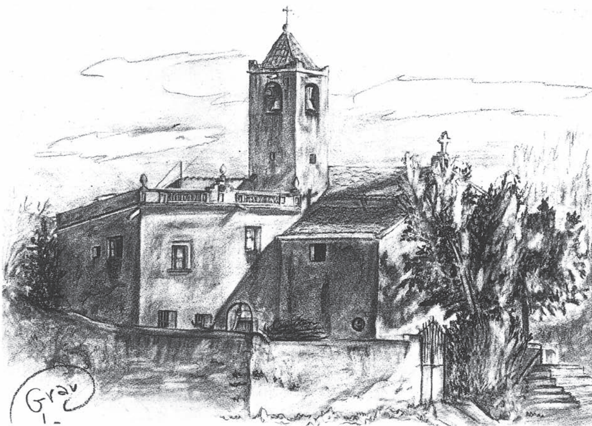
La rectoria de Pacs, dibuix de Grau.

..... em posa verdaderament malalt, el que no em contestin (Bisbat de Menorca), afegint-hi