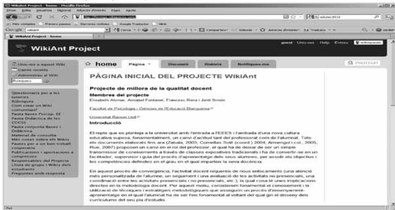
Figura 2. Pàgina principal Projecte WikiAnt

En una segona fase (octubre 2008 – febrer 2009), es van elaborar diversos materials que es poden consultar al http://www.wikiant.com , com ara: