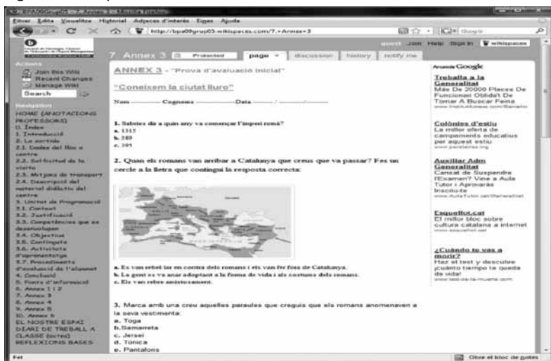
Figura 5. Exemple de Wiki d'estudiants

Els alumnes anaven fent el seu treball i el professorat, tant amb trobades presencials com, mitjançant el wiki, anaven supervisant no tan sols el procés que feia el grup, sinó també el contingut del treball. Setmanalment, els professors fèiem comentaris i suggeriments al voltant del treball que s'estava fent.