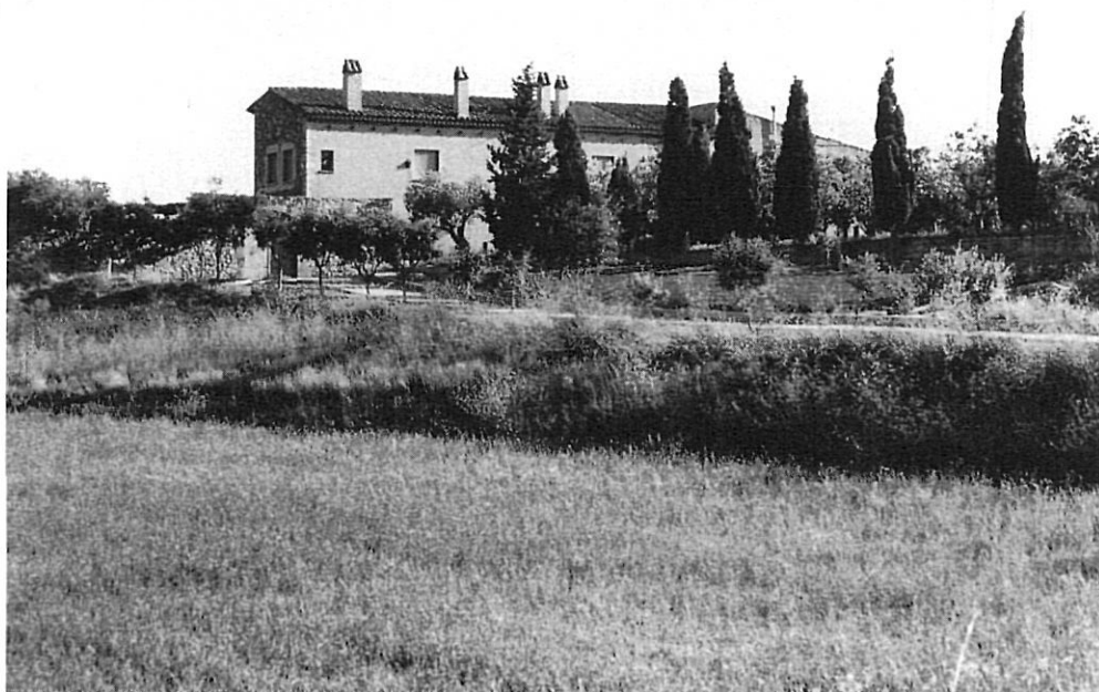
L'actual masia construïda, i restaurada de poc, on estava emplaçat l'antic cenobi.