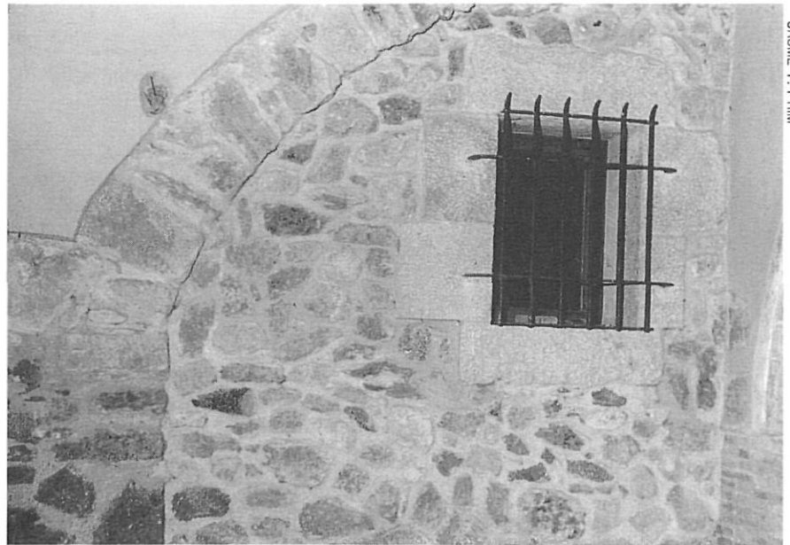
JAUME T. PRIM

A la vila de Castelló, el dia 5 de desembre de 1374, es va signar l'escriptura d'annexió. Segons el pergamí de l'antic arxiu de les canongesses de Peralada (pergamí 556 x 400 mm) diu així: «L'última priora Garsenda de Canadal amb Beatriu de Montpalau, monja, i Sibila