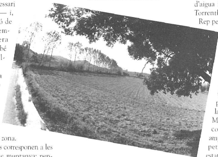
La línia precisa d'arbres de ribera ens mostra el curs decidit de l'Aubi en direcció a les seves desembocadures.

Rep per la dreta també, la riera dels Sois, que baixa del puig Teret, prop de can Borbon. Més avall, li tributa també per la dreta el petit torrent de la Genisa. Entre la riera dels Sois i el torrent de la Genisa, rep per l'esquerra el rec Gran, que baixa des del puig de Cucala. Arribem al veïnat que porta el nom del torrent i travessa la carretera a través del pont d'en Miques. Des d'allà i fins a la seva confluència amb l'Aubi és un curs ample. Prop d'aquest punt trobem un petit pont sobre l'Aubi, també en estat bastant ruïnós.