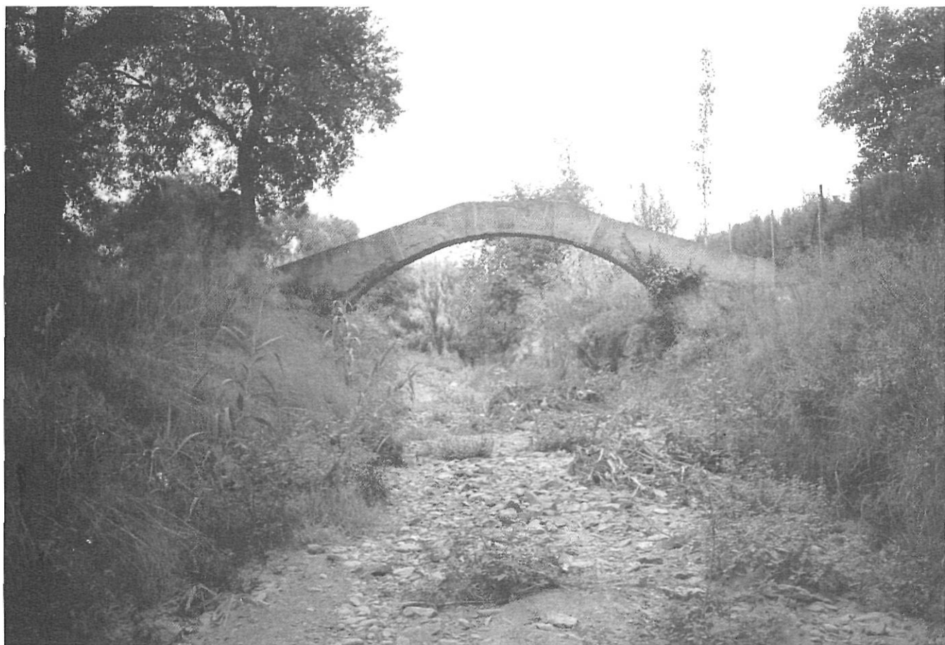
El llit de l'Aubi i un vell pont en el terme de Mont-ras. El segueix paral·lelament el camí ral de Palamós a Palafrugell.

per la gent de Mont-ras. En aquesta àrea trobem també la font de can Jonama prop de la masia que porta aquest nom.