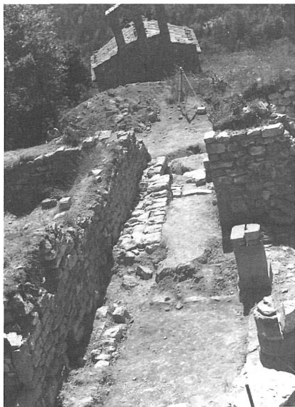
Vista general de l'entrada del castell i del pati, amb l'església de Sant Joan de Mata al fons.