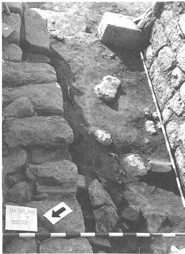
L'entrada del castell, amb el basament d'una escala adossada al mur nord, que en reduí considerablement l'espai d'accés.

En una segona fase, s'excavà la porta d'entrada al castell, tant en el seu costat intern com extern. El costat interior de l'entrada, abasta el passadís que condueix al pati interior del castell. S'intentà localitzar el paviment. La superfície del sector, d'uns 1,80 x 5 m, i limitada per murs, es veié aviat reduïda per l'aparició d'una estructura de pedres, adossada al mur nord, de 5,17 m de llarg per 1 m d'amplada, que es correspon amb la base d'una escala de finals de segle XIII. Per