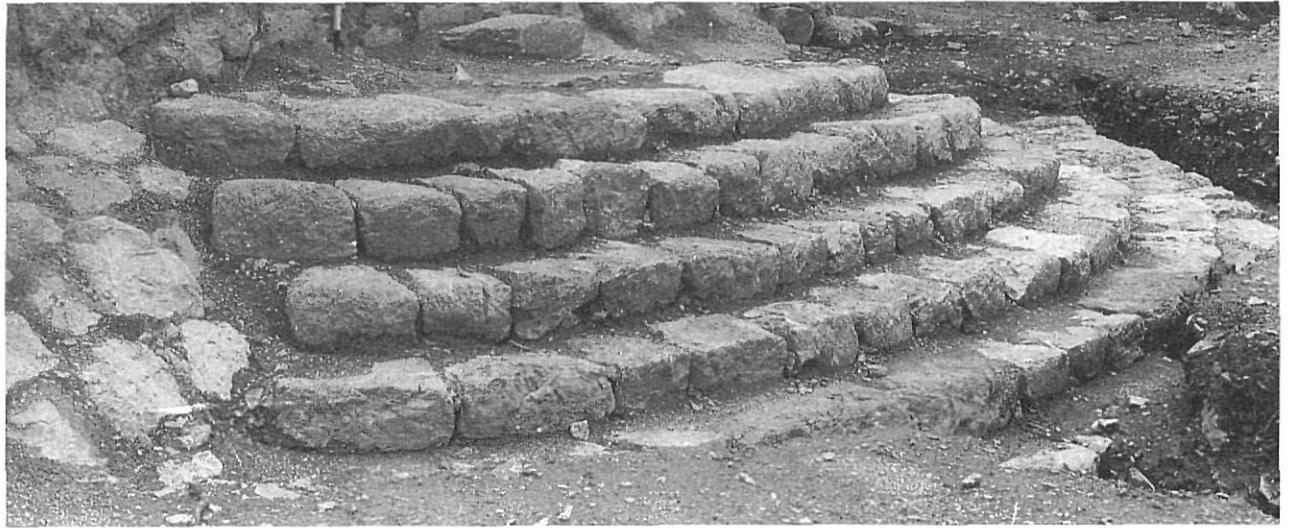
Escalinata d'entrada al castell.

potència), i de dimensions ben reduïdes (45 cm de diàmetre).