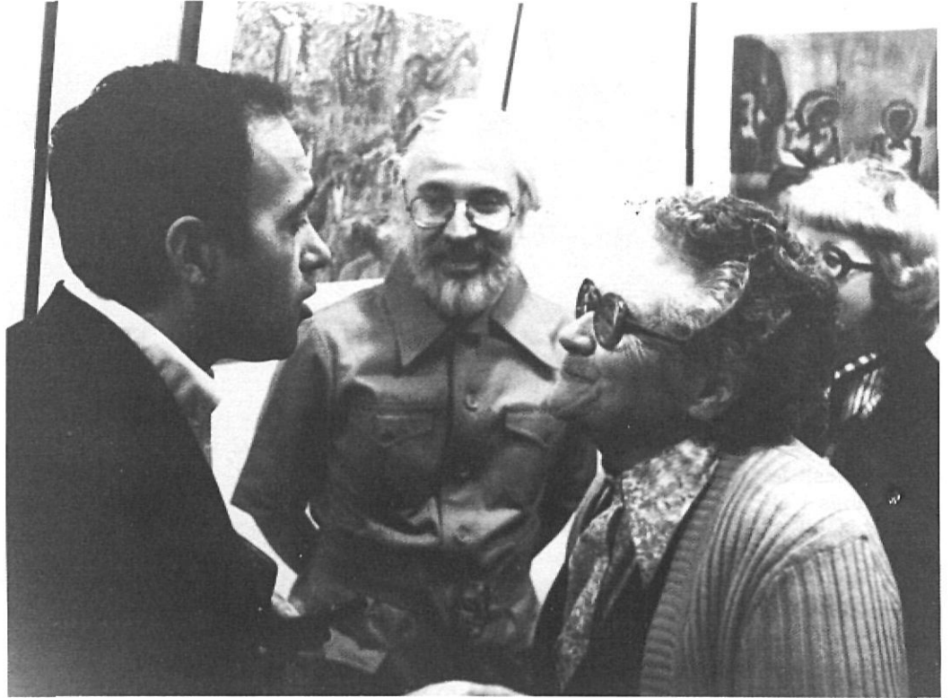
L'autor d'aquest article escolta una conversa entre Francesc Ferrer i Frederica Montseny.