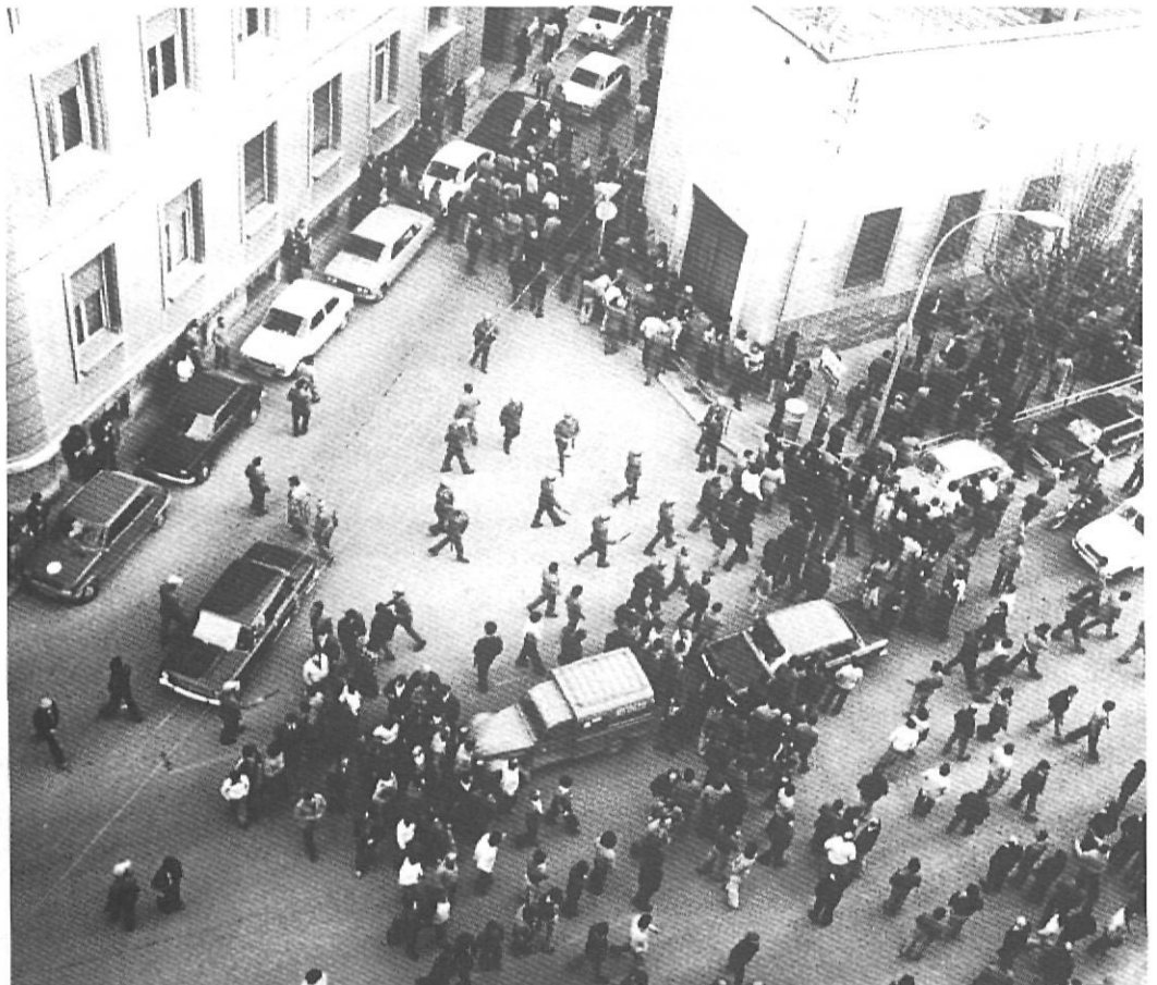
Els vaguistes de la construcció a la Gran Via, entre la Casa Sindical i el Govern Civil.