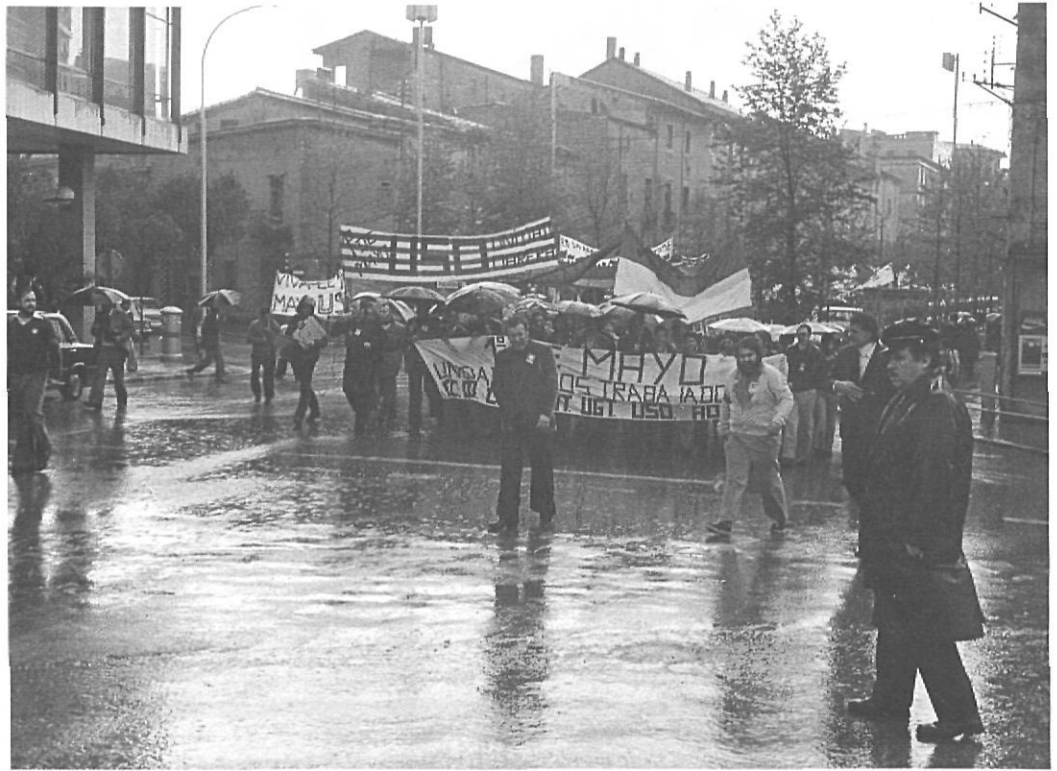
Un primer de maig sota la pluja a la plaça de Pompeu Fabra de Girona.