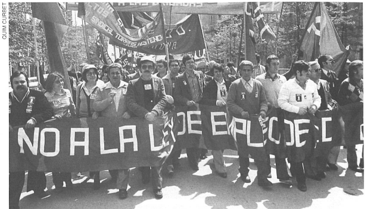
Manifestació encapçalada per líders sindicals a la plaça de l'Hospital de Girona.