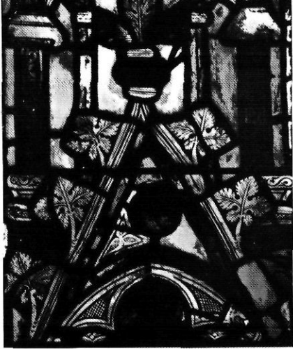
Detall del vitrall de l'Anunciació, que correspon exactament al grafisme de la taula de vitraller reproduït al costat.