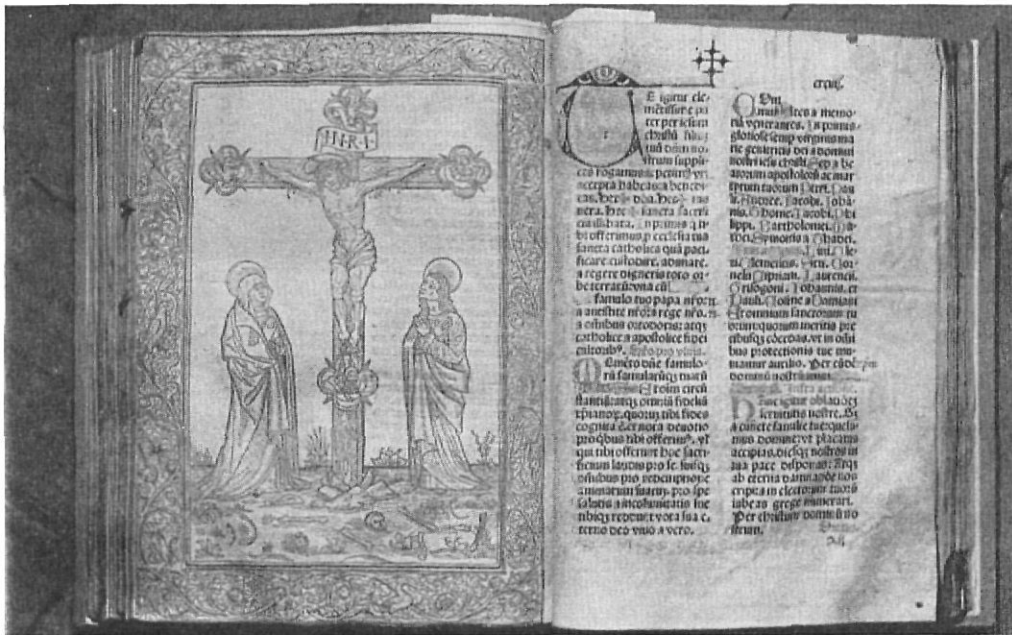
Misal de Gerona (Biblioteca Catedral)