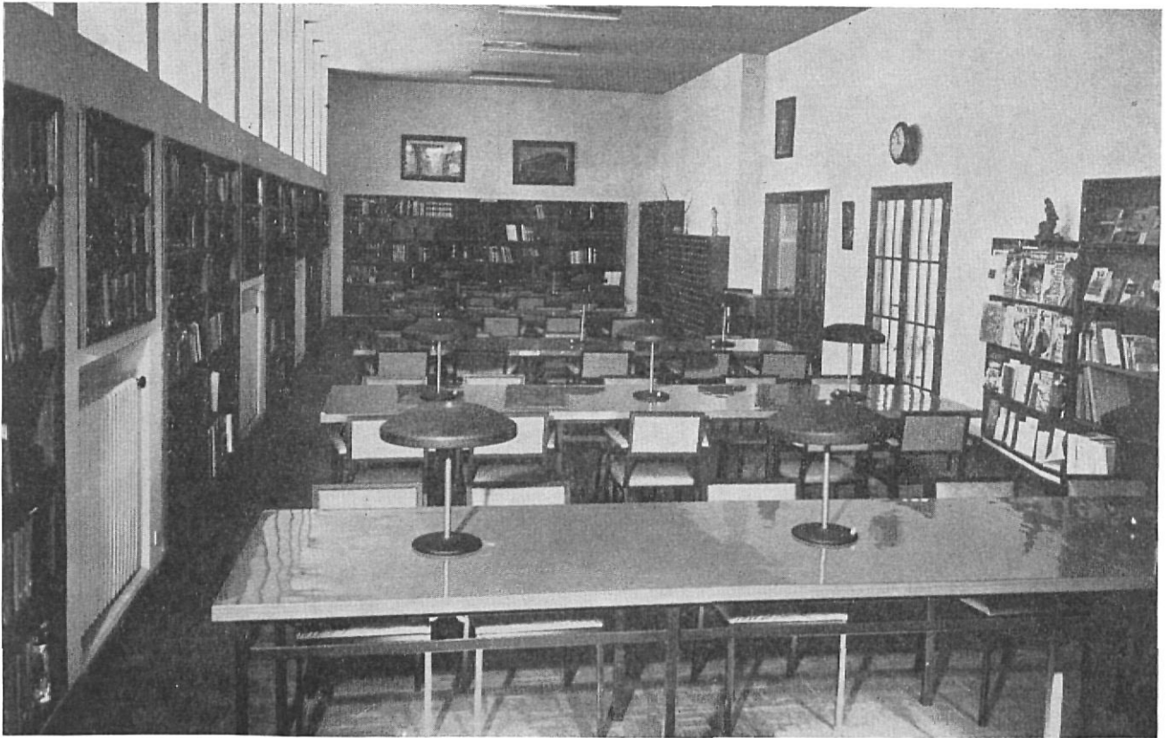
Biblioteca de Figueras. — Sala de lectura

cer las necesidades de los centros de lectura y buscar las soluciones técnicas para lograr la óptima instalación de los de nuestra provincia.