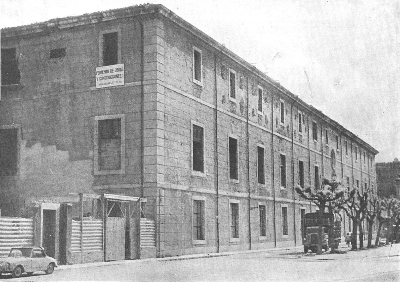
Edificio del Antiguo Hospicio Provincial convertido hoy en "Casa de Cultura", en el cual se halla instalada la nueva Biblioteca Provincial de Gerona

biblioteca municipal. Estado, Provincia y Municipio aunaban sus esfuerzos para lograr que Gerona tuviera una de las mejores bibliotecas provinciales de España.