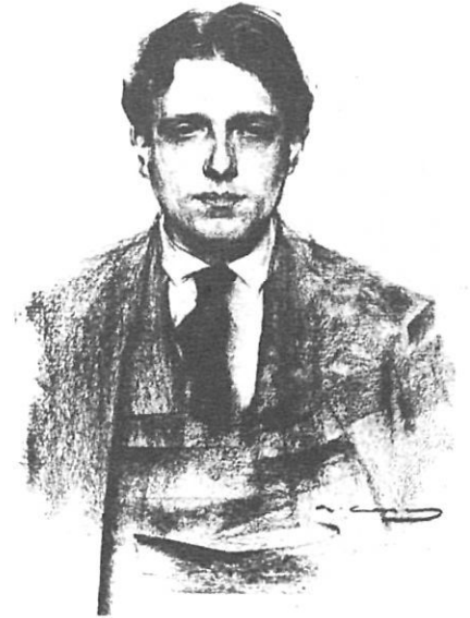
... i era un seguidor de la filosofia d'Eugeni d'Ors.