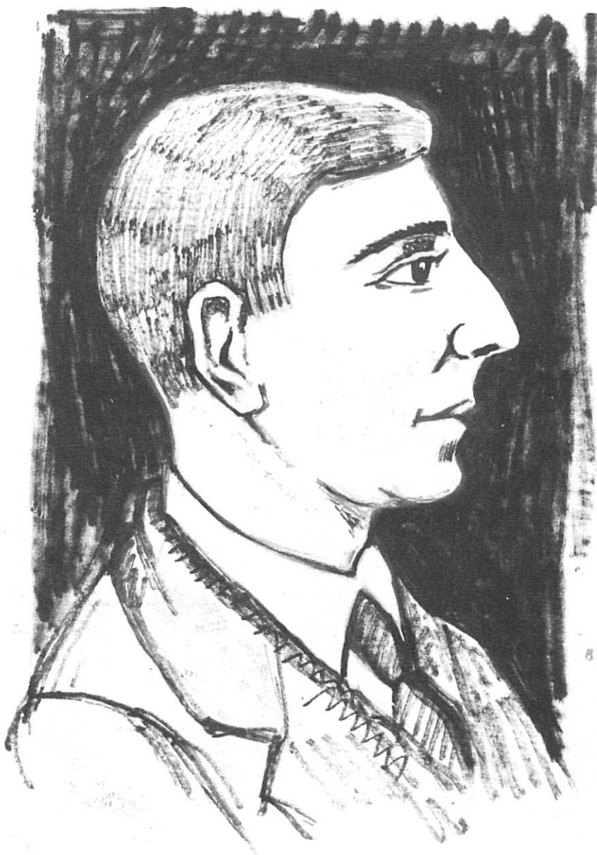
DIBUIX ENRIC MARQUÈS

Dins el ventall d'escriptors que Girona donà a l'època, hom ha de comptar amb altres autors que d'una manera o altra se sentiren atrets per la generació capdavantera del nou-