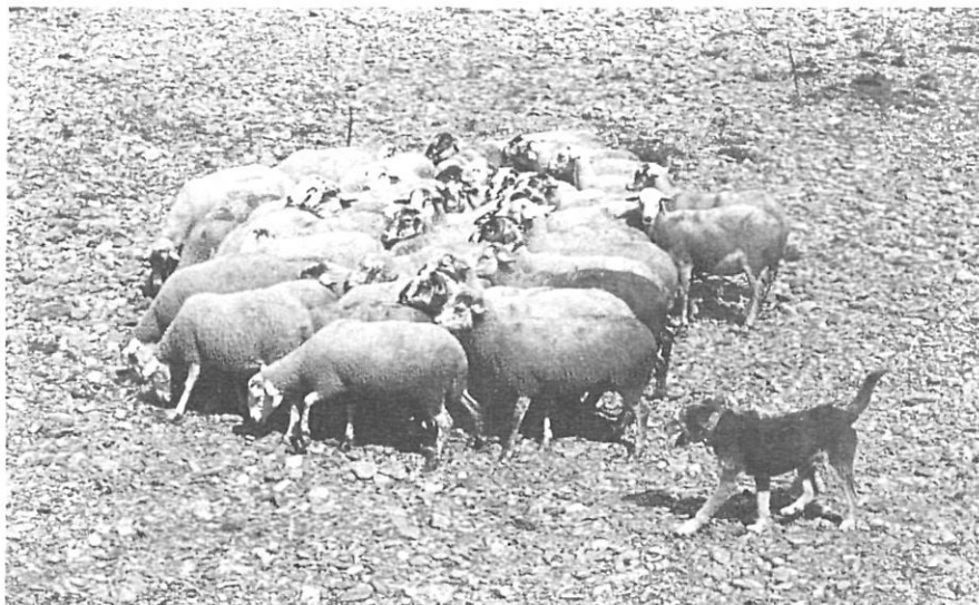
Els gossos lladren de diferents maneres, i els pagesos ho distingeixen bé.

Els homes, parlant o cantant, sols o en multitud, eren un element més del paisatge sonor. Els mercats, les fires, els aplecs produïen un mormoleig, un murmur, una remor altament sorollosa. Eren potser els únics moments en què les veus humanes s'aixecaven per sobre de qualsevol altre so. Encara avui, passejant pel Firal d'Olot un dilluns al matí (dia de mercat), hom pot experimentar l'agradable sensació de sentir-se acústicament envoltat per la gatzara, la xerinola i la cridòria dels pagesos de la comarca.