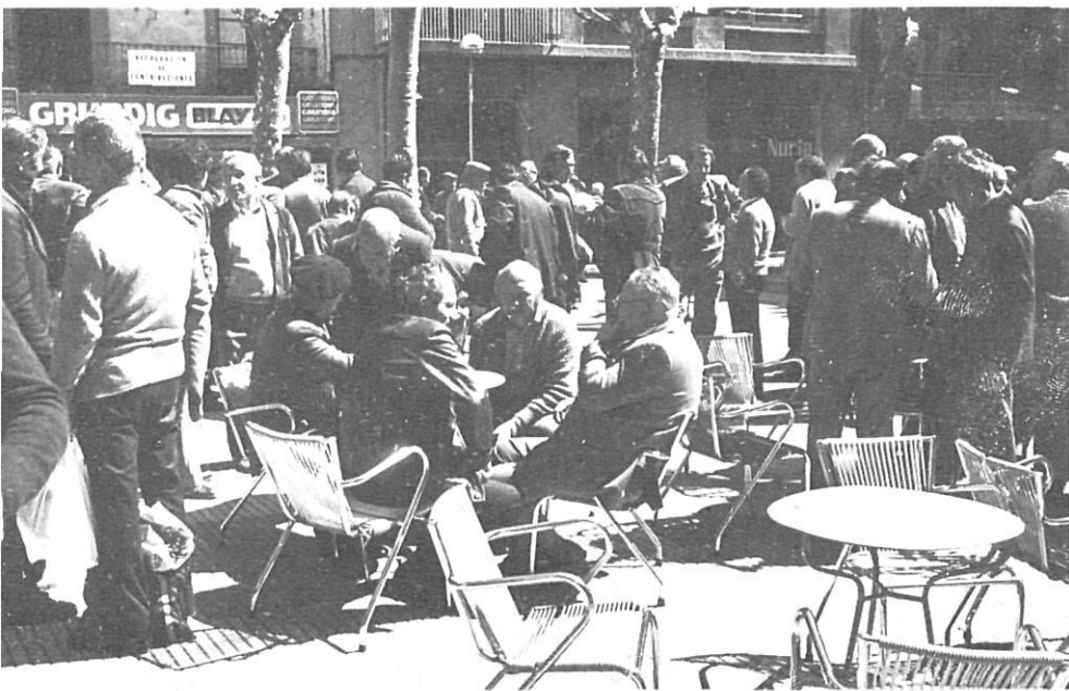
Encara avui, passejant pel Firal d'Olot un dilluns al matí, hom se sent acústicament envoltat per la cridòria dels pagesos.

El repic de les campanes era un dels pocs sons "metàlics" que trencava el silenci de les societats tradicionals. La seva llarga tradició secular li havia atorgat el privilegi d'esdevenir un soroll inherent a la vida quotidiana. El seu so era potser el que marcava més clarament el sentit del temps i el sentit del paisatge viscut com a espai i com a temps. Era un missatge geogràfic, però també existencial, espacial i temporal. En els textos literaris de l'època —o en els qui hi fan referència—, la campana és l'element sonor més important: