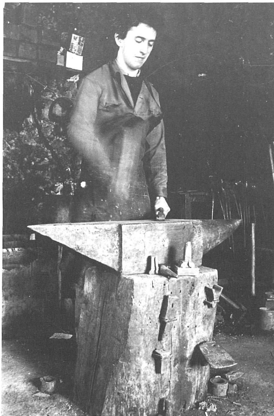
S'oïen els cops de martell dels ferrers sobre l'enclusa.

En d'altres contrades més industrialitzades i urbanitzades el paisatge sonor tradicional deixà d'existir ja a les primeres dècades del present segle. A la Garrotxa, mercès al seu relatiu aïllament, el paisatge sonor tradicional, si bé cada cop més "mecànic", perdurà de fet fins a mitjan segle. Des de llavors, i especialment al llarg dels últims vint anys, ens movem en un paisatge sonor neotècnic, provocat, bàsicament, per l'enorme increment dels vehicles de motor. Olot i aquells pobles travessats per la CC-150 tenen ja greus problemes de soroll —no tan greus, val a dir-ho, als ocasionats per