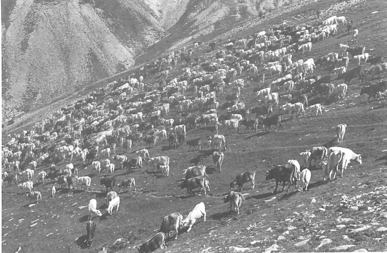
Des de la carena de les muntanyes arribava un dringar d'esquelles, mig païvagat, que a poc a poc s'apropava i es feia més perceptible.

De l'enorme i suggeridora gamma de temes d'estudi proposats per la geografia humanística, aquest article n'escolleix un, fortament relacionat amb la geografia històrica. A través de l'anàlisi del paisatge sonor tradicional de la Garrotxa hom pretén mig albirar, d'una manera forçosament sectorial i superficial, com podia ser el paisatge existencial tradicional de finals del segle XIX i primera meitat del segle XX de la mateixa contrada és a dir, el paisatge realment "viscut" i "sentit" pels seus habitants.