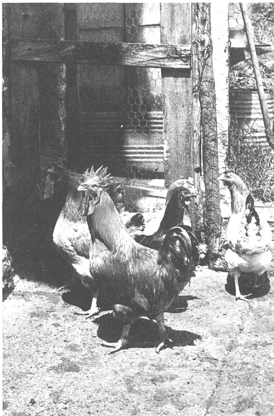
Els animals domèstics formaven part inseparable del paisatge sonor.

la CN-II al bell mig de Girona— produïts per l'excessiu tràfec rodat. Els sorolls augmenten de nivell anualment i les veus dels homes i les remors de la natura són cada dia més i més ofegades. El fenomen és descrit amb gràcia per Eugenio Turri. Escoltem-lo en el seu propi idioma —l'Italià—, una llengua d'agradable modulació rítmica i de bella cadència sonora: