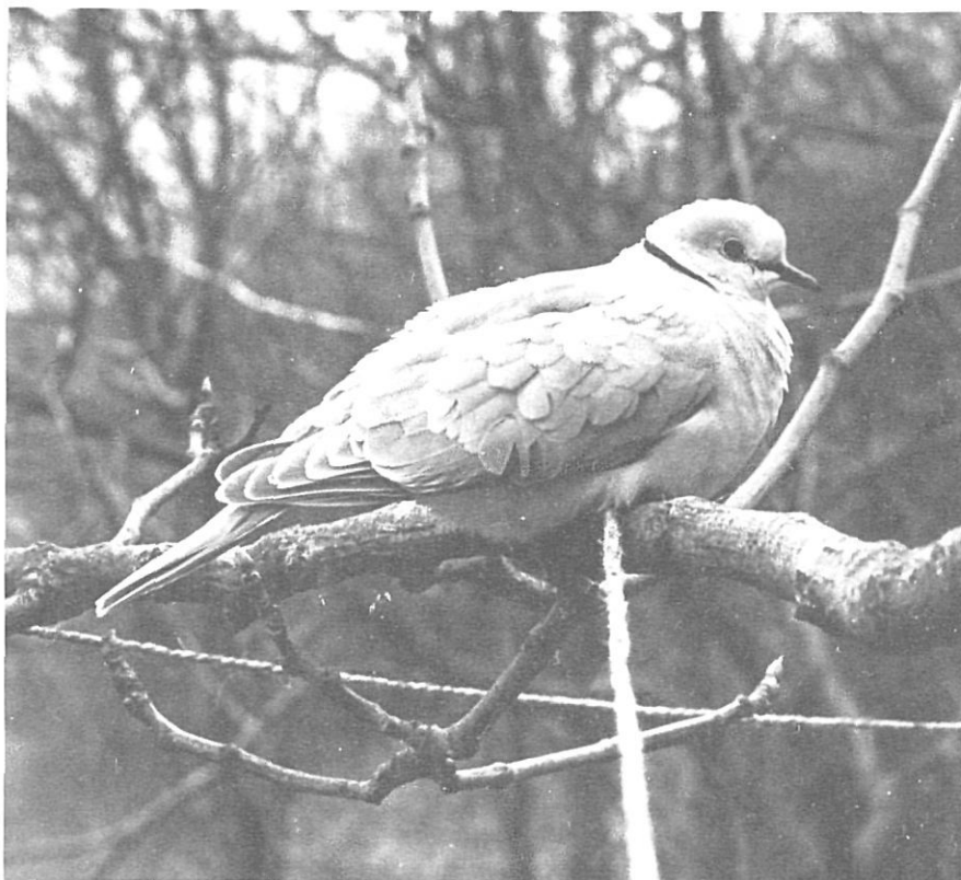
Els sorolls del món rural, com el cant dels ocells, estan íntimament lligats als cicles estacionals.