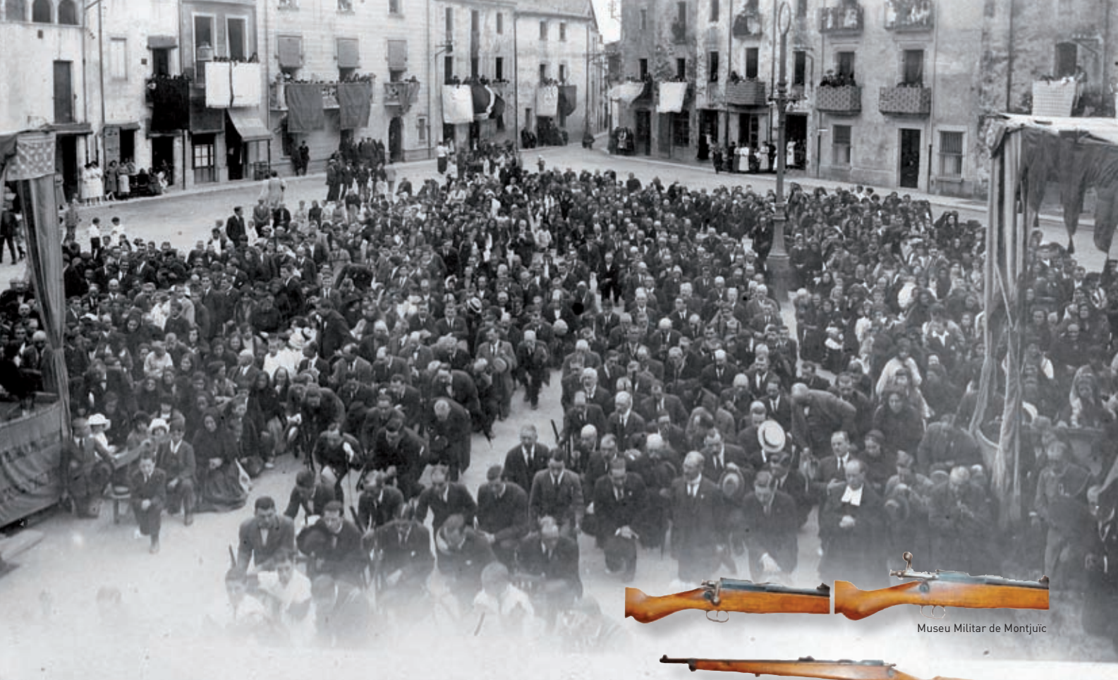
Museu Militar de Montjuïc