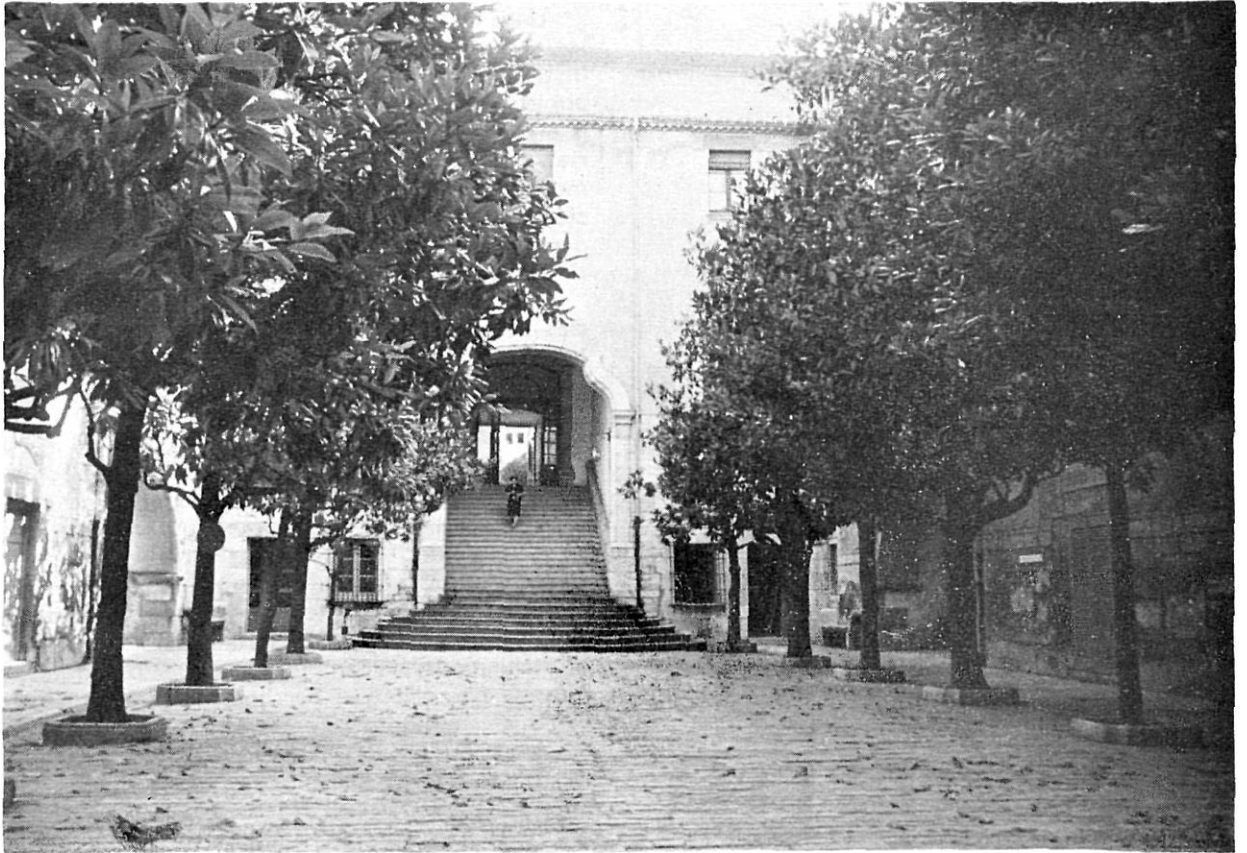
Paviment del pati de l'actual Hospital.