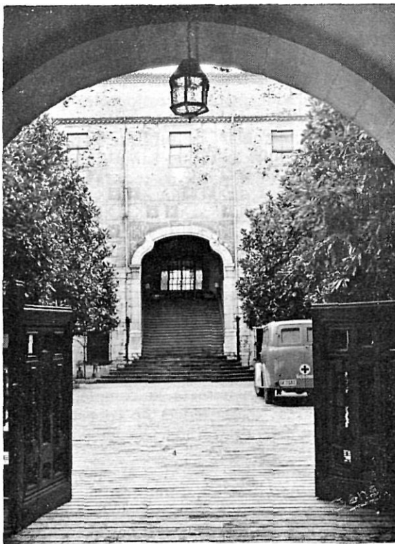
Entrada de l'actual Hospital.

Com a normativa principal s'estableix, com a serveis bàsics indispensables de tot Hospital General l'existència de: