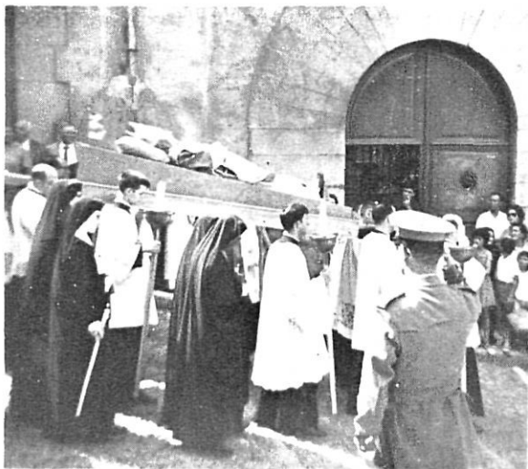
Processó d'enterrament del bisbe Cartaña (3 d'agost del 1963).

autos, a fin de que V. I. tenga conocimiento del proceder del indultado», sens dubte per tal que fos castigat pel mateix bisbe de Girona.