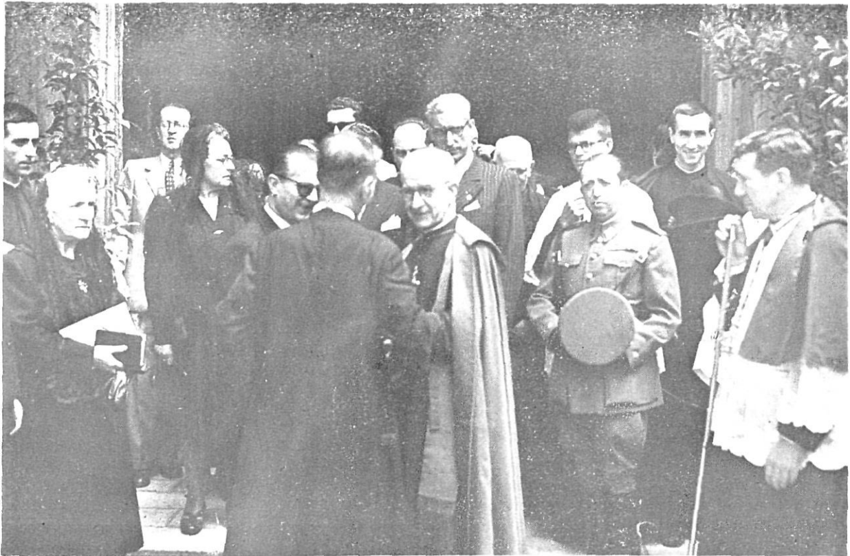
Una típica estampa de la postguerra: El bisbe Cartaña i les autoritats de Girona a la sortida de l'església de Sant Feliu.

roní de la repressió del 1939— havia caigut afusellat ran de les tàpies del cementiri de Girona (7).