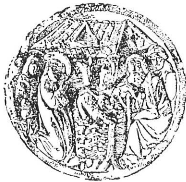
El naixement del Salvador. Clau de volta del període gòtic.

temptetur. Si quis autem, quod non credimus, in aliquibus frangere temptaverint sciat se, nisi resipuerit, auctoritate Dei Omnipotentis et Sancti Petri apostolorum principis atque nostra qui eius fungimur vicariam orationem anathematis vinculis indissolubilis esse innodandum et a regno Dei alienandum. Et cum diabolo et eius atrocissimis pompis atque cum Iuda traditoris Domini nostri Iesu Christi aeterni incendi concremandum et in voraginem tartareos que chaos demersus cum impiis deputentur. Qui vero custos et observator extiterit benedictionis gratia et celeste retributionis a iusto iudice Domino Deo nostro multipliciter consequatur et vite eterne particeps esse mereatur. Scriptum per manum Stephani notarii regionarii atque scrinarii supra scripte sancte nostre ecclesie romane. In mense decembrio per indictione supra dicta decima. Bene valete.