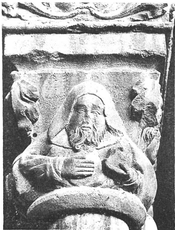
Ripoll. - Capitel·l gòtic.

notable un Arnulf, de la casa vescomtal d'Osona, que entre el 990 i el 992 signava com ardiaca i abat de Sant Feliu de Girona i entre el 993 i el 1010 fou bisbe de Vic sense deixar d'ésser abat de Sant Feliu.