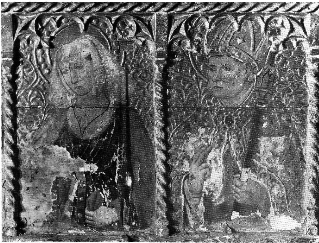
Dos quadres de la predella del retaule, en el costat de l'Epístola. Representant un Sant Bisbe i una Santa no verge.