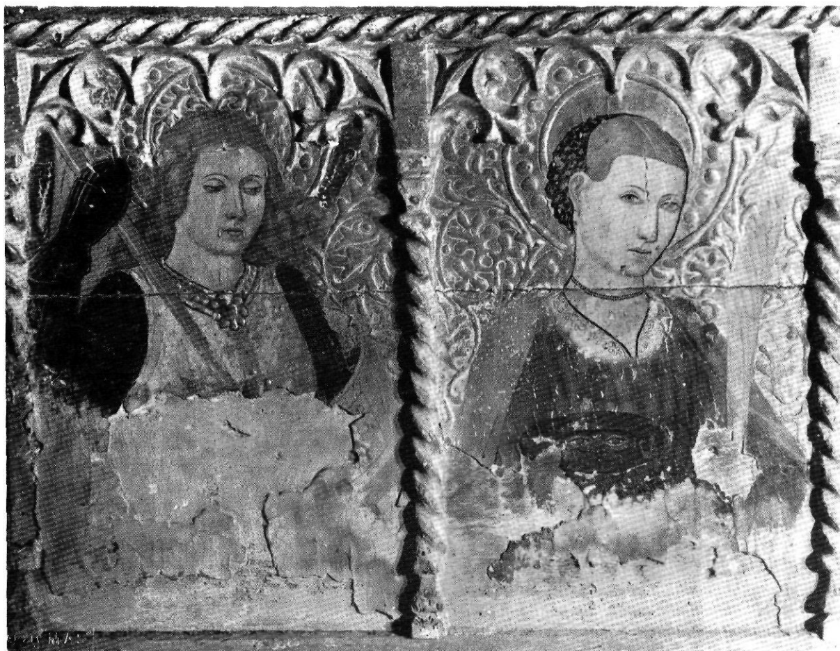
Dos quadres de la predel·la del retaule en el costat de l'Evangeli. Representa a Sant Jordi i a Sta. Llúcia.

ja una mica allunyats, es veuen uns edificis, com també a la dreta i al lluny es veu un conglomerat d'edificis i torres.