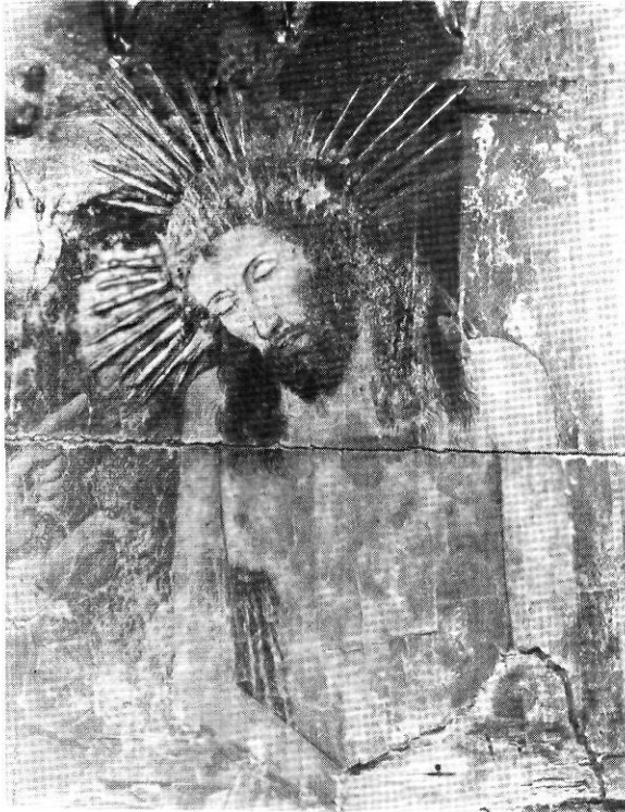
Quadre central de la predel·la del retaule. Representa a Crist mort.

tell, el qual li cobreix només una part del cap. La mà dreta de la Verge insinua una actitud de reserva o sorpresa, mentre l'esquerra es manté sobre els llibres sagrats que hi ha damunt de la taula del pupitre. L'artista trobà encara un recurs artístic, que trobem en altres quadres semblants i d'artistes diferents, però que en aquest cas és d'una notable exquisitesa, i és un gerro, situat a terra, damunt mateix del paviment de l'estança, i que separa les dues figures. El gerro, delicat i fi, conté unes flors, probablement assutzenes, que arriben a l'altura de mig cos de les dues figures. L'àngel i la Verge porten corona, si bé la de l'àngel, més senzilla, no té més decoració que uns pics que l'emmarquen, i la corona de la Verge conté una decoració floral en tot el seu interior.