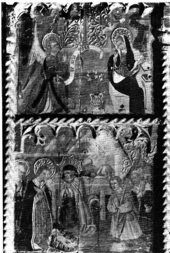
Dos quadres del retaule de la Verge: representen l'Anunciació i l'Adoració dels pastors.

i el nom del retaule. S'en deia el retaule de la Mare de Déu. Potser originàriament havia existit aquest quadre amb una pintura representant a la Verge. El cas és que en la fotografia que tenim, no hi ha cap pintura. El que hi ha és una fornícula amb una imatge o talla de la Verge, si bé és evident que tampoc es tracta d'una marededéu gòtica, sinó d'època molt posterior, barroca.