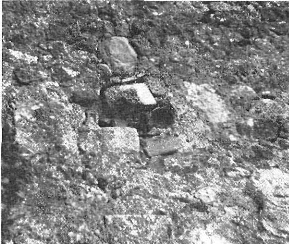
Restos de cráneos empotrados en la pared del castillo

Los vecinos de los tres pueblos disconformes con la actuación del barón debían reunir la cantidad necesaria para la redención y entregarla al rey para que éste recuperara la jurisdicción. Debían organizarse en sociedad, «sindicato», tener reuniones y tratados previos entre ellos, lo cual no podían realizar porque el barón no sólo no les daba licencia para reunirse, sino que, además, por medio de sus agentes coaccionaba a los vecinos de los otros pueblos para que no firmaran en el compromiso de redención.