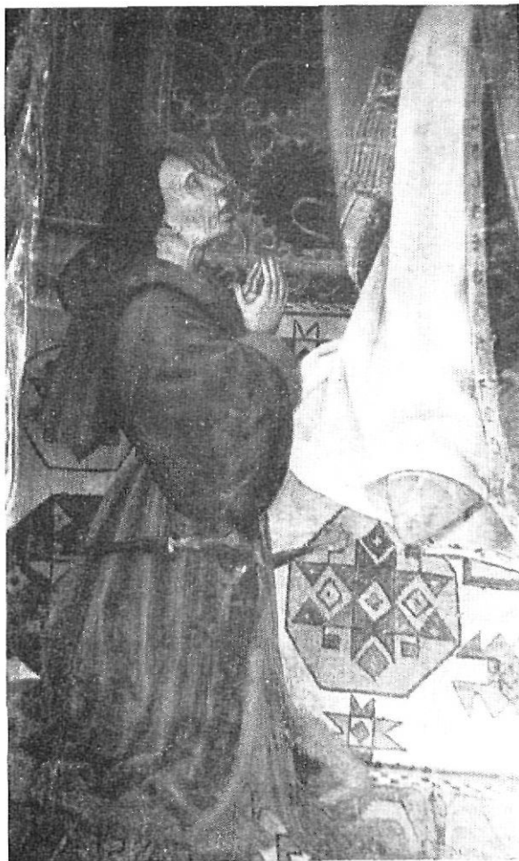
Retrato de Bernardo de Corbera

Dada la extensión de esos documentos no es posible traducirlos aquí íntegramente. Son interesantes para la toponimia local, en gran parte todavía persistente en el lenguaje vivo.