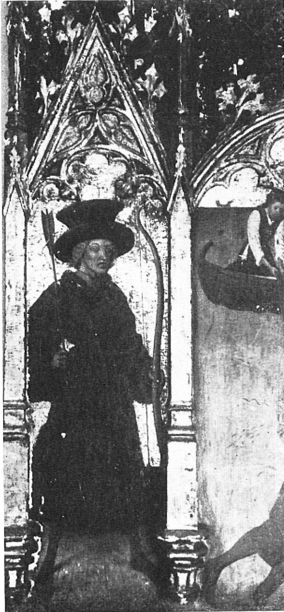
Supuesto retrato de Jaime de Campllong

El escudo de Corbera ostenta en campo de oro un cuervo de sable pasante hacia la izquierda. El enlace de Margarita de Campllong con Bernardo de Corbera ha de remontarse al año 1422, en que el rey Alfonso el Magnánimo empeñó el castillo de Púbol a Bernardo de Campllong-Corbera por el precio de 1.900 florines.