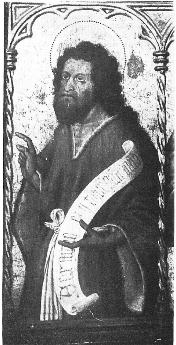
San Juan Bautista