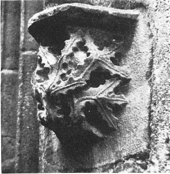
Ménsula del ventanal del patio interior

6.º Que en los dos trienios siguientes don Francisco Gallart doncel, sea baile y pueda reunir el pueblo, recoger tallas y demás para elegir cuatro jurados: dos de La Pera, como lugar mayor, uno de Pedrinyà y uno de Caça y doce consejeros, 6 de La Pera, tres de Pedrinyà y tres de Caça.