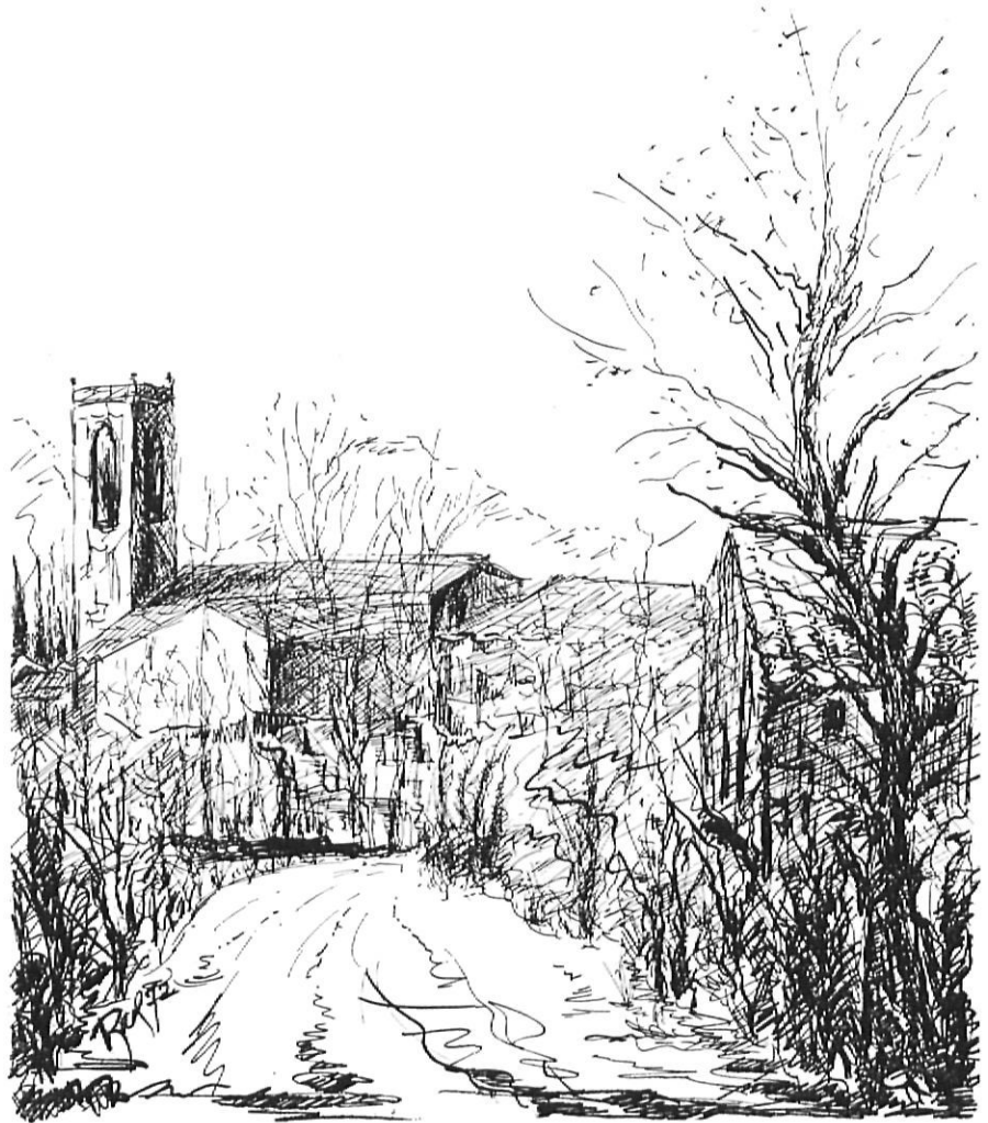
FIG. I. — Vista general