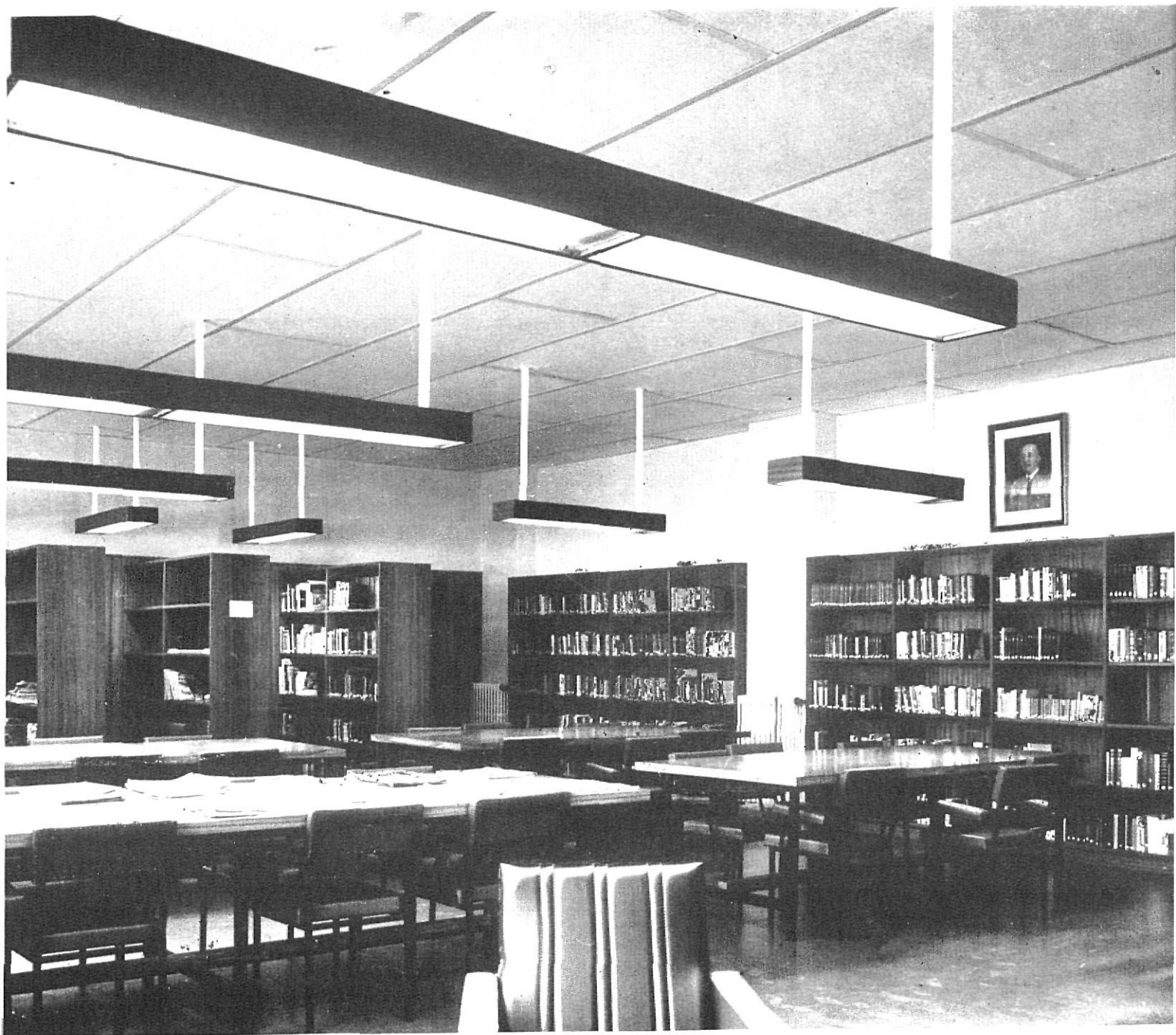
Sala de lectura de la BIBLIOTECA MUNICIPAL de SALT