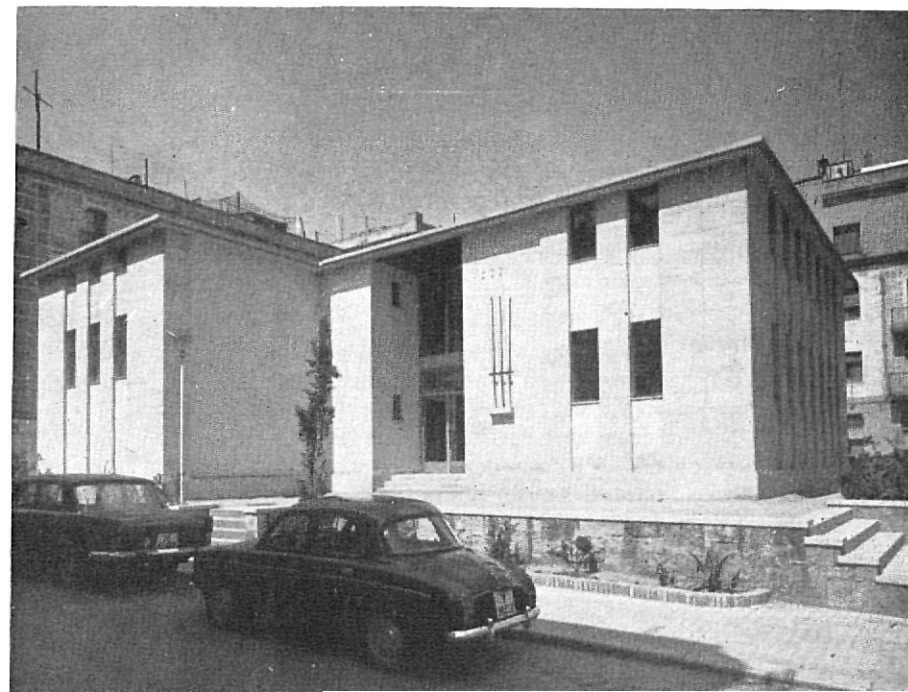
Sala de lectura de la Biblioteca Popular de Figueras

El edificio fue costado por el Ministerio de Educación y Ciencia y la Diputación.