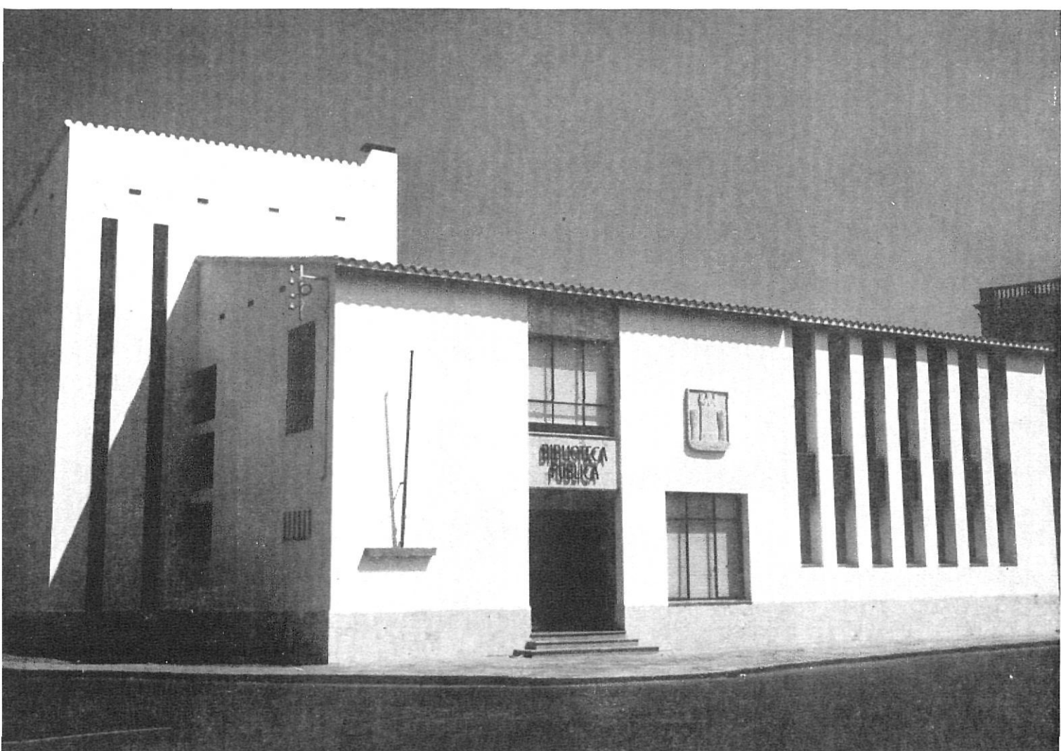
Edificio de la CASA DE CULTURA, JOSÉ PLA en Palafrugell

BIBLIOTECA PÚBLICA DE ANGLÉS. — En edificio de la Caja de Ahorros de la Diputación Provincial. Cuenta con una sala de lectura con dos compartimientos para adultos el uno y para niños el otro.