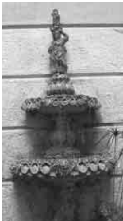
Font del final del segle XIX, del pati del Museu de la Joguina de Sant Feliu de Guíxols, amb reproduccions de la petxina del pelegrí ( Pecten ).

fragments polits de petxines ( Spondylus ), amb uns trets que n'assenyalen l'ús com a eines per a fregament i/o poliment de pell, cuir, etc.