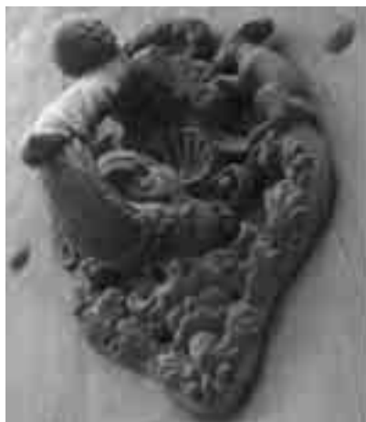
Poms de porta amb motius malacològics (Girona).

A l'obra de l'arquitecte noucentista gironí Rafael Masó (1880-1935) també hi estan representats els mol·luscs. Per exemple, a banda i banda de l'entrada de la casa Ribas Crehuet, a carrer de la Força de Girona, hi ha esculpides les reproduccions de dos cargols marins ( Ocenebra erinaceus ) que vessen fruits, símbol de l'abundància.