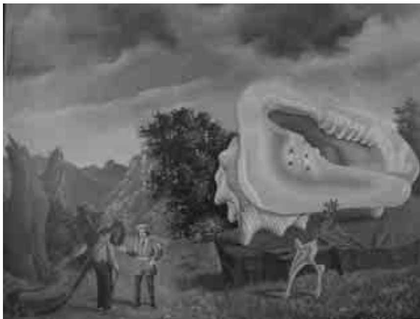
FOTO DEL CATALÀGUE PLANELLS SURREALISTA. 2004. P. 123.

De l'associació de l'home amb els mol·luscs se'n tenen evidències des de fa milers d'anys, ja que de sempre han constituït un important recurs alimen-