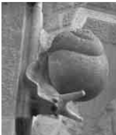
Dos detalls de la Sagrada Família que reproduïen mol·luscs (cargol d'hort i cargol marí, Bolinus brandaris )

En arquitectura, l'escala de cargol és l'element més immediatament relacionat amb la malacologia. De manera més formal, els mol·luscs s'incorporen a l'arquitectura amb l'estil