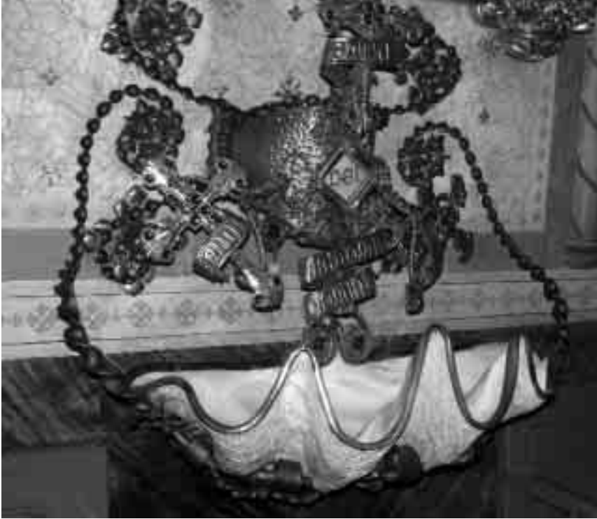
Tridacna utilitzada com a pica d'aigua beneïta (església de les josefines, Girona) obra de Rafael Masó (1907).

germanes josefines de Girona és formada per una valva de Tridacna , una petxina procedent de l'oceà Pacífic i que pot assolir mides superiors a un metre de diàmetre. L'ornamentació de la conquilla es deu a l'arquitecte Rafael Masó (1907). Segons sembla, la parella d'aquesta valva es troba al monestir benedictí de Montserrat, al Bages. En el pati de la casa Vilaret de Sant Feliu de Guíxols (actual Museu de la Joguina), reformat el 1894, es va introduir una font de terracota amb els elements decoratius representant conquilles de la petxina de pelegrí ( Pecten ), bonic exemple de la utilització dels mol·luscs com a material d'inspiració. En el tema del mobiliari, cal remarcar el d'estil alfonsí, força comú al nostre territori, que, tot i ser més auster que l'estil isabelí precedent, va incorporar sovint representacions de mol·luscs en la marqueteria.