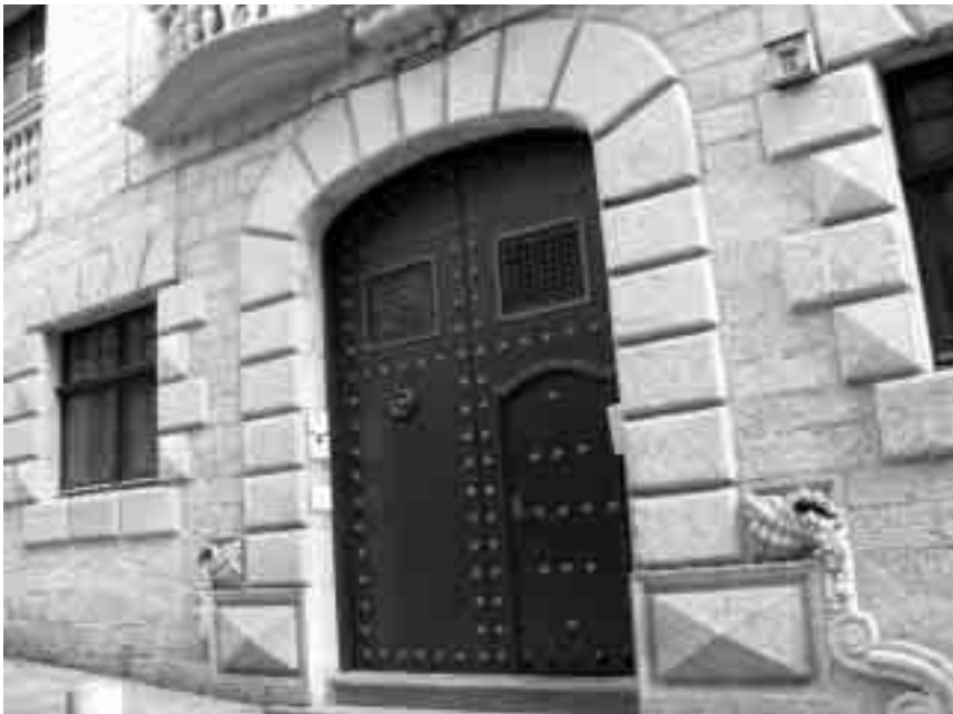
Casa Ribas Crehuet, carrer de la Força (Girona), amb reproduccions d' Ocenebra erinaceus , obra de Rafel Masó.

rococó, nascut al segle XVIII a França. El nom prové de les paraules franceses rocaille (pedra) i conquille (conquilla), ambdós elements fonamentals en la decoració d'exteriors i d'interiors. El rococó mostra predilecció per les formes ondulades o irregulars, i incorpora abundants elements naturals com ara les conquilles, els vegetals i els còdols. Aquest estil no va tenir gaire implantació al nostre territori, però els referents naturals van retornar amb gran força durant el modernisme, al final del segle XIX.