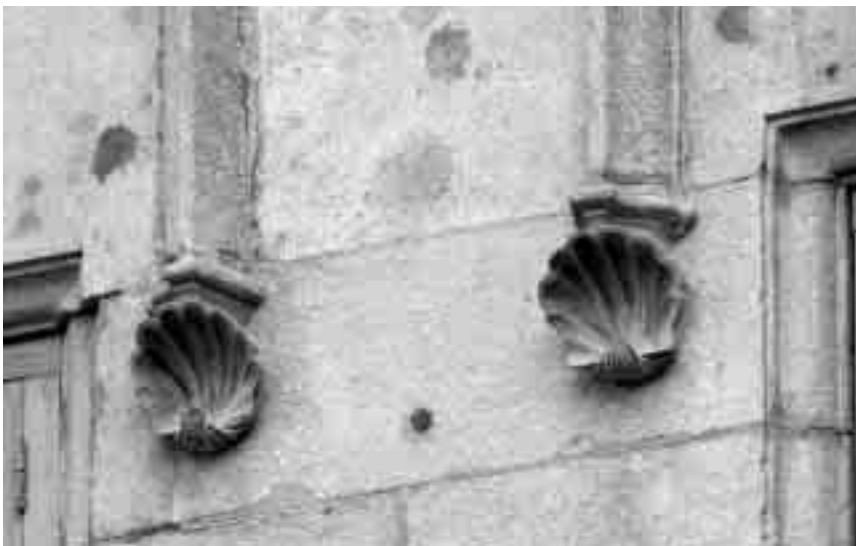
Detall de la façana de l'ajuntament de Girona amb reproduccions de Pecten .

El jaciment de la Fonollera (Torroella de Montgrí), de l'edat del Bronze (1.400 anys aC), és especialment interessant des del punt de vista malacològic, ja que s'hi presenten tres usos diferents dels mol·luscs. En primer lloc, la presència de diverses espècies marines comestibles (pagellides, petxinots, petxines de pelegrí, nacres, escopinyes, cloïsses) n'indica l'ús alimentari. Després, la troballa en una sepultura d'una acumulació d'origen antròpic del cargol de terra Rumina decollata a la zona de les mans del cadàver fa pensar en algun tipus de ritual funerari. Per últim, també hi apareixen