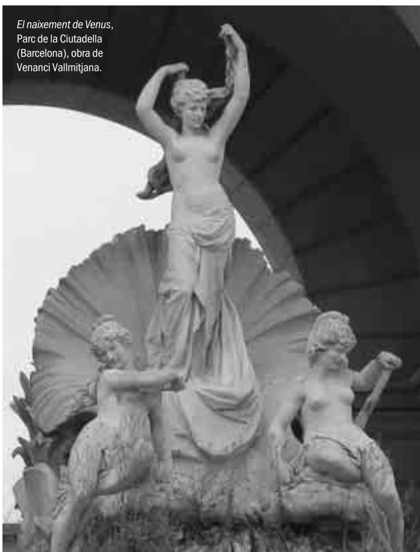
El naixement de Venus, Parc de la Ciutadella (Barcelona), obra de Venanci Vallmitjana.

Els mol·luscs (cargols de mar i de terra, petxines, pops, sípies) són animals invertebrats força populars, sobretot pel seu valor gastronòmic. Tanmateix, són també presents a molts altres àmbits de la nostra vida des de temps immemorials. Les conquilles dels mol·luscs han estat des de símbols mitològics o religiosos (identificador dels pelegrins, per exemple) fins a objectes de comerç, material per a la fabricació de guarniments, estris domèstics o instruments musicals.