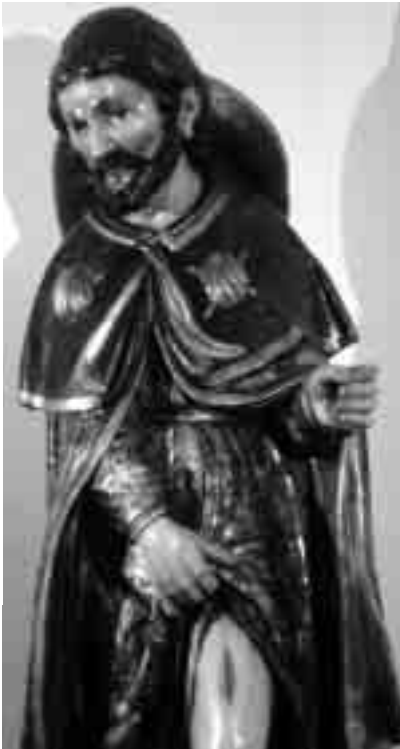
Talla que representa sant Roc (s. XVII), conservada al Museu d'Art de Girona.

L'arquitecte barceloní Francesc Folguera (1891-1960), col·laborador de Masó, fou l'autor de l'original xalet Montseny de s'Agaró, d'estil modernista, que incorporava com a elements ornamentals força referències a la natura. El dipòsit d'aigua estava sustentat per tres pilars, a la part mitjana dels quals hi havia representades tres valves gegantines de la petxina de pelegrí ( Pecten ). Aquest xalet fou enderrocat l'any 1949, en obrir-se el camí de ronda que uneix les platges de Sant Pol i la Conca, però en queda una àmplia documentació fotogràfica.