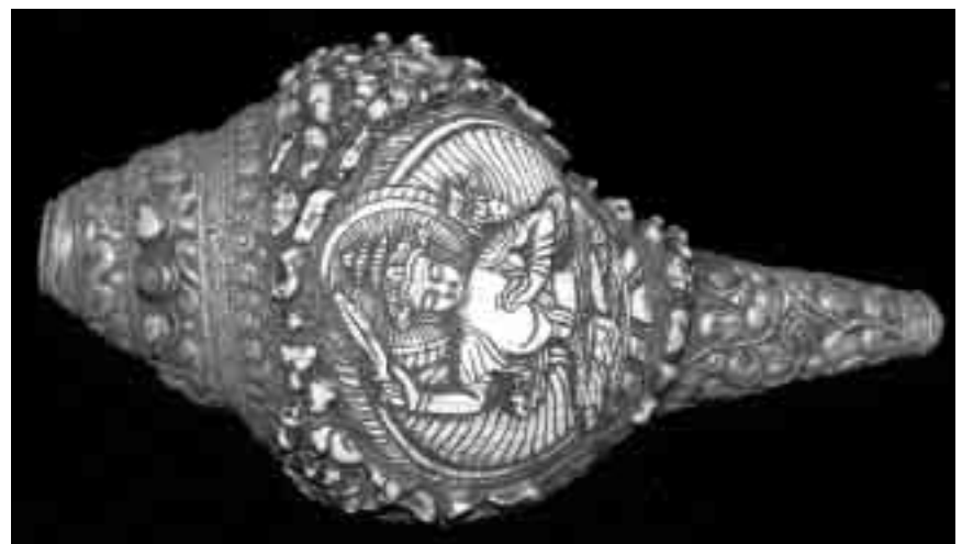
Trompeta tibetana esculpida en una conquilla de Turbinella i ornamentada amb turqueses i plata.

Com a arts decoratives entenem els objectes artístics mòbils o de petit format (ceràmica, decoració, metall, mobiliari, vidre, joieria, mosaic, tèxtil). Els mol·luscs hi han figurat en in comptables ocasions en aquests camps de l'art, i alguns exemples són ben a prop nostre. Per exemple, la pica d'aigua beneïda de l'església de les