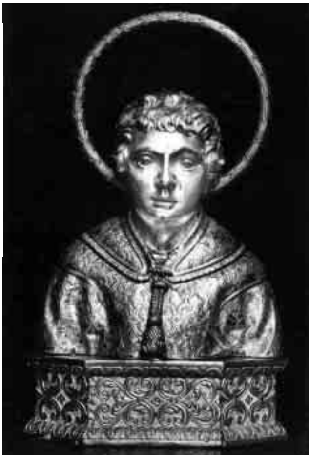
Cap d'argent, avui desaparegut, que contenia les relíquies del crani de sant Feliu. Fou col·locat a l'interior del sarcòfag paleocristià del sant, situat a l'altar major de Sant Feliu de Girona, el 8 d'agost de 1801