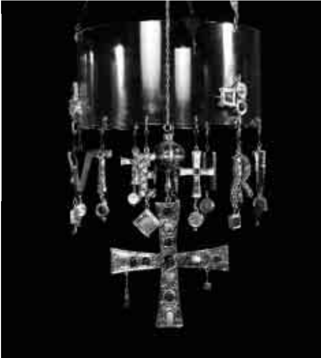
Restitució d'una corona votiva visigòtica del segle VII procedent del Tresor de Torredonjimeno (Jaén), a partir dels elements originals que es conserven al Museu d'Arqueologia de Catalunya.

D'aquest temple martirial no en tenim cap altra notícia fins al segle VII. Els darrers decennis d'aquesta centúria (vers 642-690), el bisbe i historiador Julià de Toledo, en la seva crònica sobre la sublevació de Paulus contra el rei Vamba, es referí a l'edifici dedicat al màrtir gironí i al sepulcre que es guardava en el seu clos. Gràcies a aquesta obra sabem que el rei Recared (586-601) havia regalat a final del segle VI una corona votiva d'or al sepulcre del sant, corona que el rebel Paulus va prendre durant la revolta que dirigí contra Vamba (673) i amb la qual posteriorment es va coronar en proclamar-se «rex Orientalis» ( Historia Wambae Regis 26, 672-682). Aquesta corona, juntament amb molts altres tresors aplegats pels rebels, va ser recuperada a Nemausus (Nimes) i retornada a la basílica gironina després de la desfeta i posterior rendició de Paulus a les tropes reials.