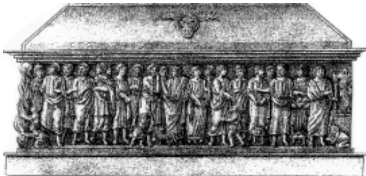
Dibuix idealitzat del sepulcre paleocristià de sant Feliu aparegut al volum dedicat a la ciutat de Girona de la España Sagrada de A. Merino i J. De la Canal (1832).

És també significativa la làpida funerària del bisbe Servusdei encastada als murs del presbiteri actual del temple de Sant Feliu. Ens informa que aquest prelat hi fou sebollit l'any 906, tot cercant la proximitat de la tomba martirial dins d'una manera de fer ben documentada d'ençà de l'antiguitat tardana en ciutats on hi havia