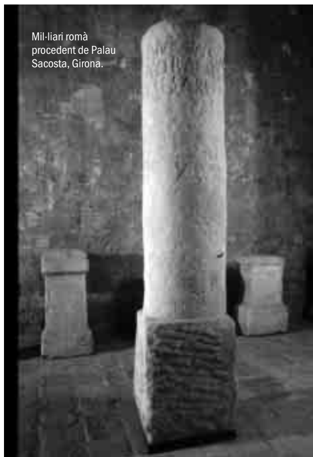
Mil·liari romà procedent de Palau Sacosta, Girona.

La ciutat que havia nascut com a fortalesa, amb voluntat de dominar el vell i extraordinàriament important camí d'Hèracles, després Via Augusta, havia deixat pas, com a conseqüència de la llarga etapa de pau que va obrir el principat d'August, a una situació diferent on les activitats agrícoles i ramaderes i l'intercanvi