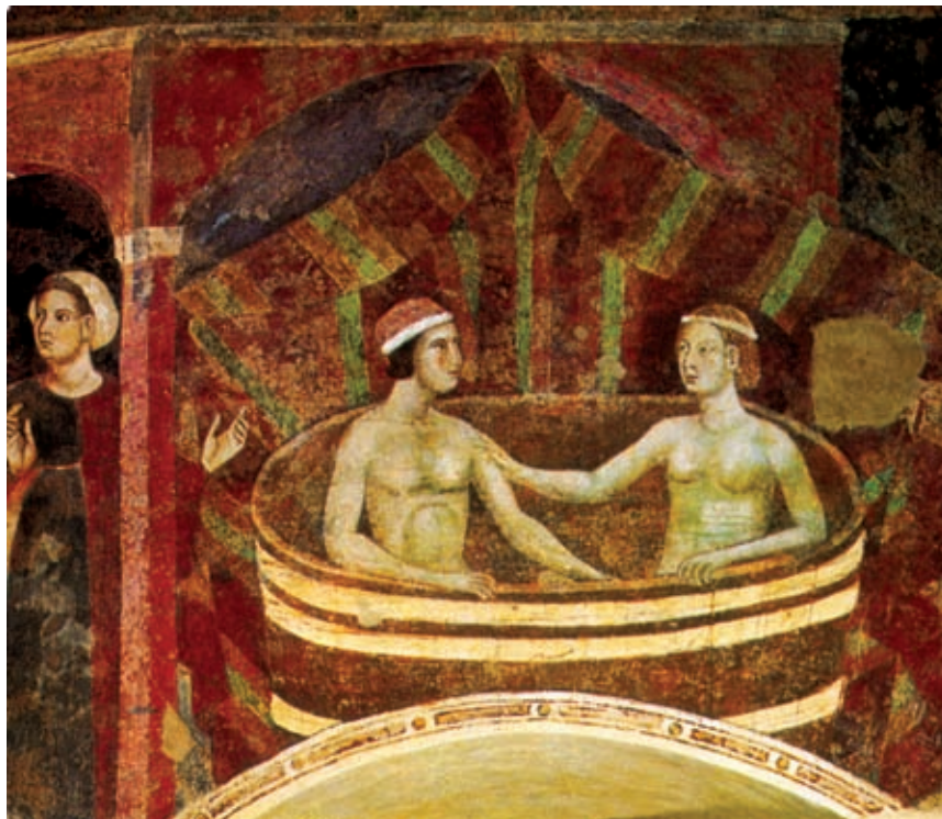
>> Escena nupcial de Niccolò di Segna.

socialment acceptat, per exterioritzar l'agressivitat i la sexualitat. Amb els acudits, sobretot els «verds», expressem temes que habitualment reprimim. Però la carn vol carn, deia Ausiàs March, i això no es pot contradir. Calidoscopi de clixés i creences que ajuden, en definitiva, a fer un pas més cap a la comprensió de la laberíntica i contradictòria condició humana, que no només viu de metafísics i teòlegs sinó d'instints i passions. Una natura catalana, en aquest cas: els homes i les dones catalans tenim una psicologia sexual pròpia i intransferible. Ras i curt: estimem i cardem en un català gens eixut. I no volem interferències.