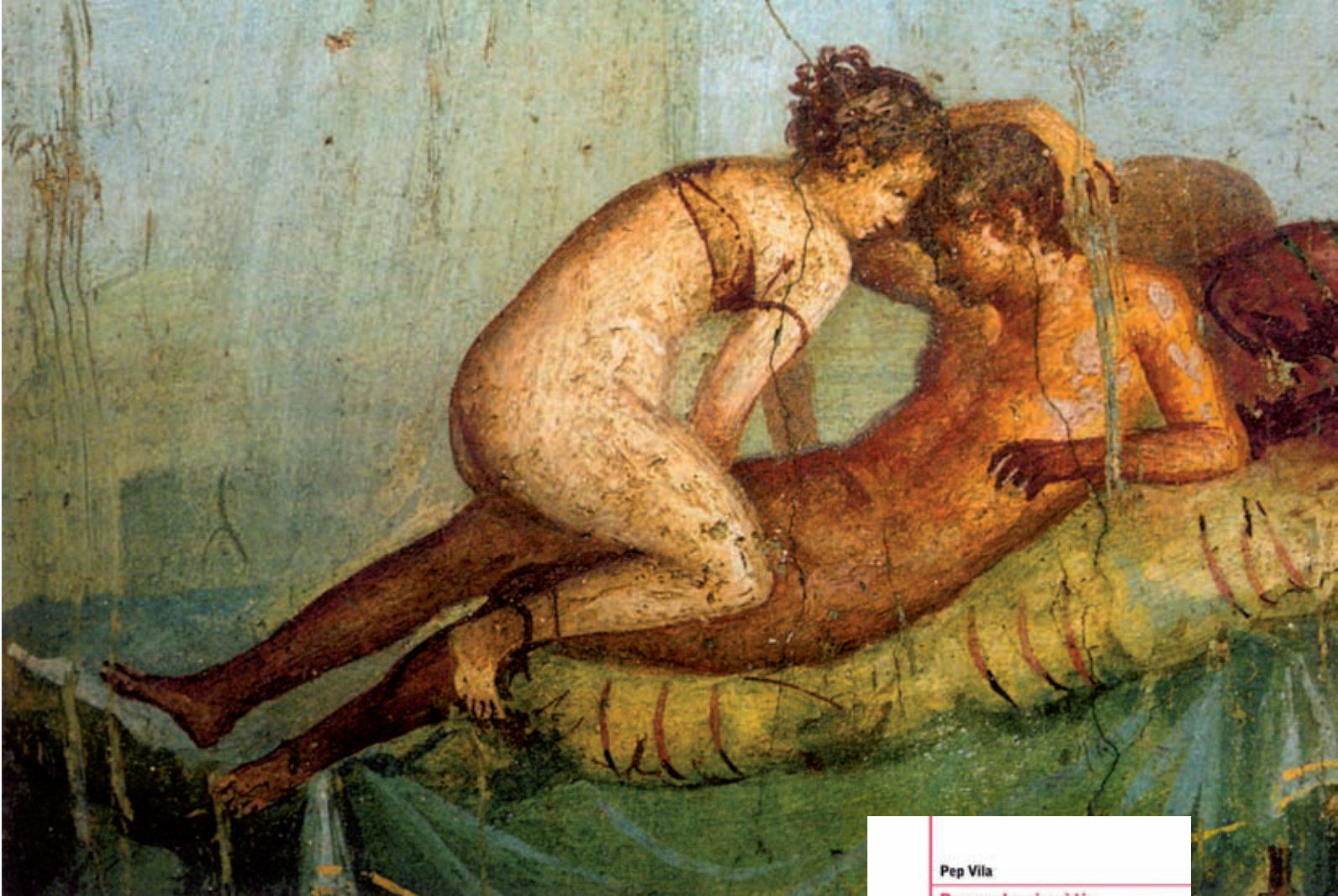
QRDG 137 ELS SENTITS D'EROS

sempre és un reflex dels canvis socials i culturals que pateix una comunitat.