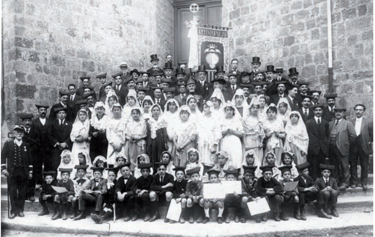
>> Retrat de grup de l'Orfeó Popular Olotí (1918).

que mantien aquestes velles entitats, però també és cert que la seva filosofia i essència basada en la cooperació, el voluntariat i el fet d'haver crescut i sobreviscut en un entorn de precarietat econòmica permanent les ha agafat més preparades per al declivi.