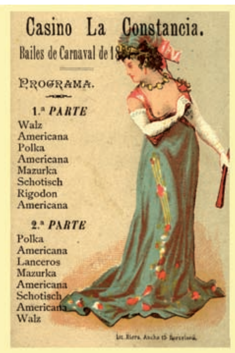
AM STI. FELIU DE GUÍXOLS