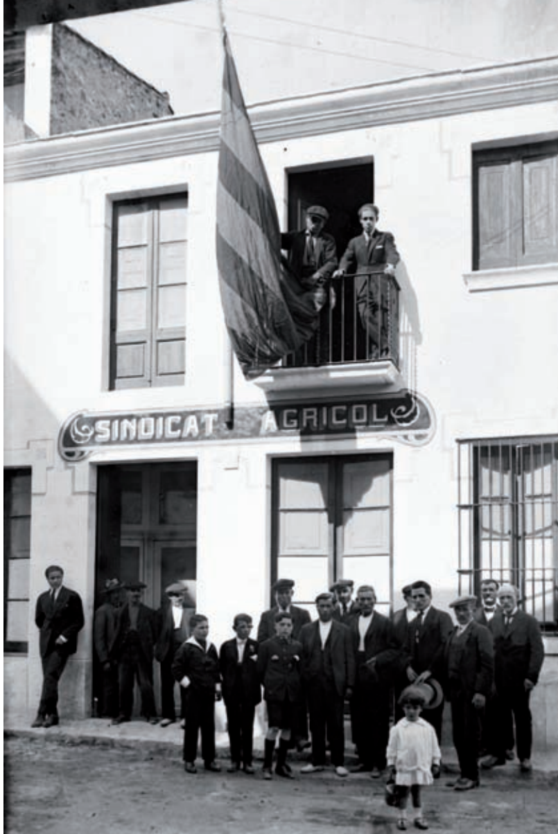
SAM LLORET DE MAR. - FONTS FAMILIA MARTÍNEZ-PLANAS. AUTOR: EMILI MARTÍNEZ PASSAPERA

A les poblacions amb una classe benestant rellevant políticament i socialment, les primeres associacions que apareixen són els casinos dels senyors. Aquests centres perseguïen l'entreteniment dels socis, és a dir, foren de caràcter estrictament recreatiu, i les expressions polítiques no hi eren permeses. És el cas del Casino Gerundense (1845) a Girona o el Casino Ceretano (1875) a Puigcerdà, on també influï la presència de la burgesia barcelonina que hi estiujejava. D'altres exemples són el Círculo Olotense (1855) a Olot, del qual s'han de buscar els antecedents en la Sociedad Filarmónica Olotense (1845), o la Sociedad del Casino de la Bisbal, que impulsà la creació del Teatre Principal, un dels pocs edificis construïts exclusivament pel teixit associatiu bisbalenc. Malauradament fou destruït per un incendi després de dècades d'abandonament. Totes aquestes entitats eren elitis-