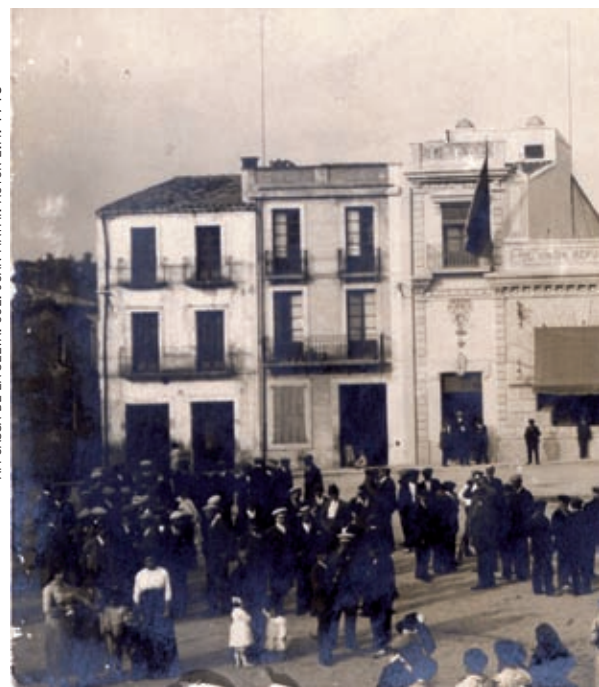
AM CASSÀ DE LA SELVA. COL·L. JOAN MAYMÍ. AUTOR L.M., 1913

de reunió i centres d'esbargiment acabaren agrupant persones que compartien una mateixa interpretació de la societat i una mateixa voluntat de preservació del seu estatus. Inquietuds polítiques i culturals queden reflectides en les activitats de les societats que tenien per centre el cafè, ànima de l'associació i font d'ingressos. Centres indiscutibles de la vida social on es practiquen jocs de taula com el billar, els escacs i nombroses variants locals de jocs de cartes, són alhora centres culturals que s'adapten a cada població per captivar el major nombre de socis possible. Sense obviar la importància de l'organització de balls i festes com carnestoltes, festes majors i revetlles, ens cal destacar el seu paper formador amb la programació de classes de lectura i l'ensenyament del català o l'intercanvi i difusió d'idees mitjançant tertúlies, vetllades literàries i conferències. Les biblioteques, amb un nombre respectable de llibres i exemplars de la premsa local, són peces fonamentals per a la culturalització dels socis. I finalment, foren els llocs clau per difondre les expressions artístiques que havien sortit amb força al nostre país: la renovació del teatre català de la mà de Frederic Soler «Pitarra» i altres autors; l'impuls i popularització del cant coral portada a terme per Anselm