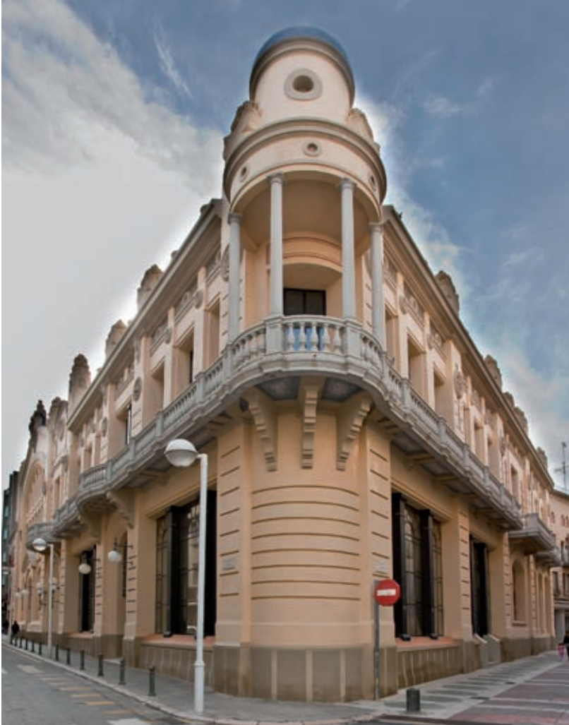
>> Façana del Casino Menestral de Figueres.