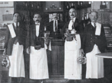
AM LLAGOSTERA, COL·L·LABANS