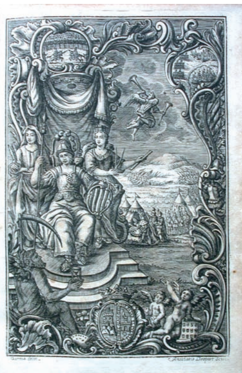
>> Francisco X. de Garma, Adarga catalana..., 1753.

Cal destacar que uns 4.500 volums del fons antic de monografies provenen de la desamortització dels béns eclesiàstics per la supressió dels ordes religiosos (1836-1851)