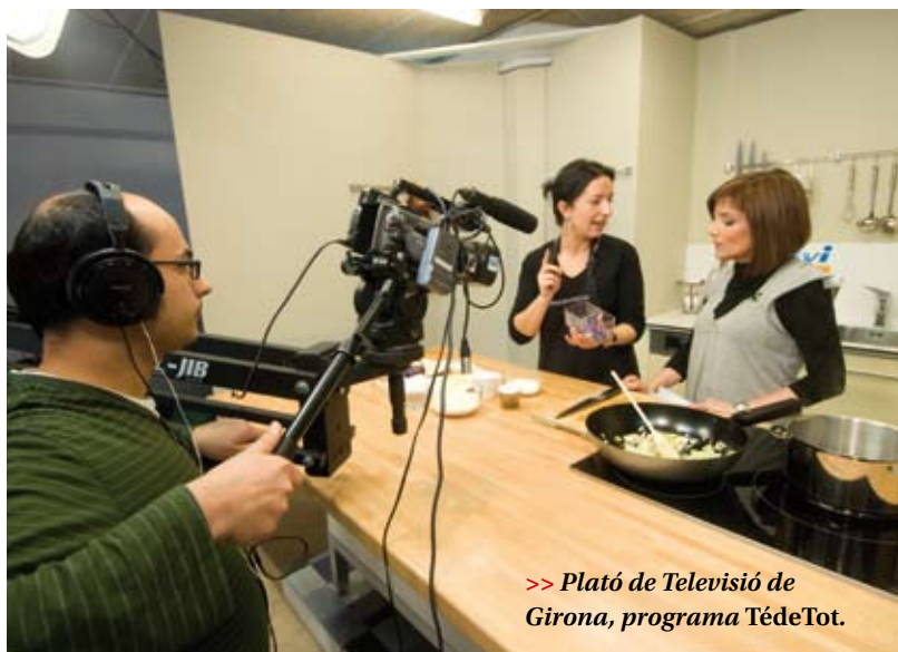
>> Plató de Televisió de Girona, programa TèdeTot.

A les comarques gironines hi ha tretze televisions locals, totes amb arrelament al territori i amb una programació propera a la realitat que els envolta