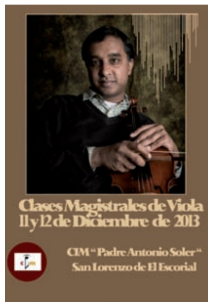
>> Clases magistrals de viola al CIM «Padre Antonio Soler» per part del violista cingalès Ashan Pillai.

Hi ha una dualitat no resolta entre la imatge devota i sacrificada del monjo i el caràcter més frívol, interessat i terrenal del geni