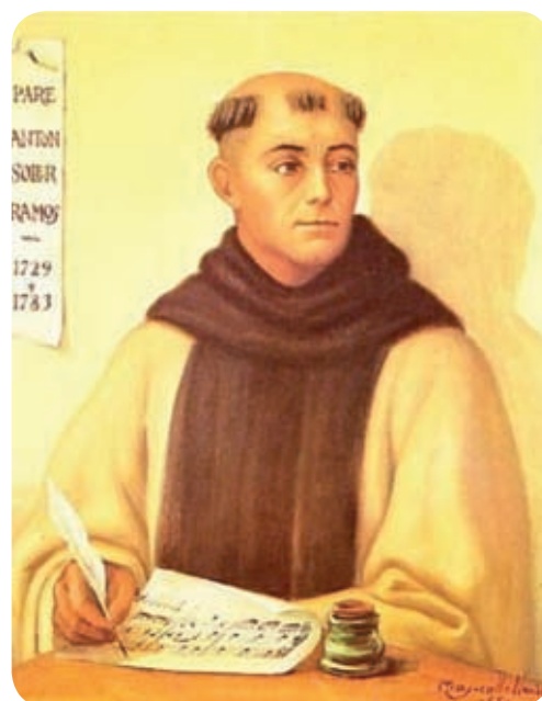
MUSEU MUNICIPAL D'OLOI

Olotí de naixement, va ser batejat el 3 de desembre de 1729. El seu pare, natural de Porrera (el Priorat), formava part de la banda musical del Regiment de Dragons de Numància