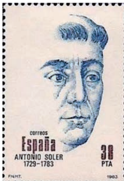
>> Edició de segells de correus en commemoració del segon centenari de la mort d'Antoni Soler.