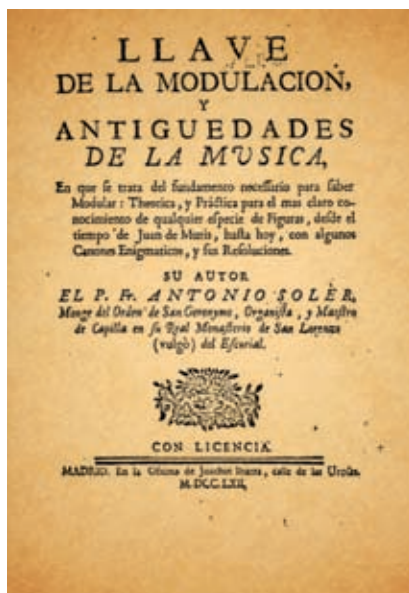
>> Portada del tractat Llave de la Modulación y Antigüedades de la Música .

Tampoc no queda demostrat que Soler s'encarregués de l'educació musical de l'infant Gabriel de Borbó, a qui va dedicar una part important de les seves composicions. Malgrat que en les Memorias sepulcrales figura que va donar lliçons de clavecí a l'infant, estudis recents semblen corroborar que entre el músic olotí i el fill de Carles III hi va haver una relació estreta però informal, en la qual el Borbó encarregaria partitures a Soler i interpretacions privades a canvi de generosos estipendis.