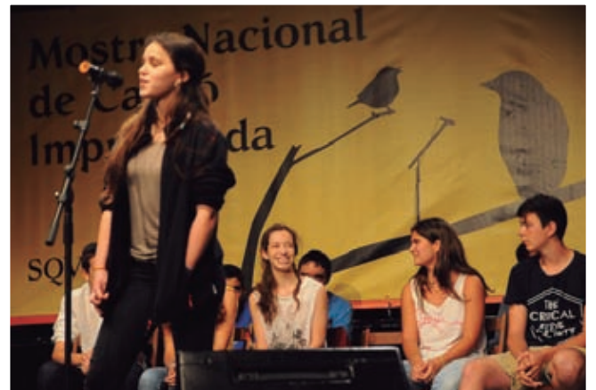
AJUNTAMENT DE SANT QUIRZE DEL VALLÈS