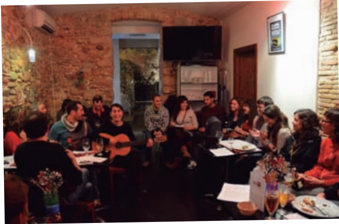
CASAL INDEPENDENTISTA EL FORN