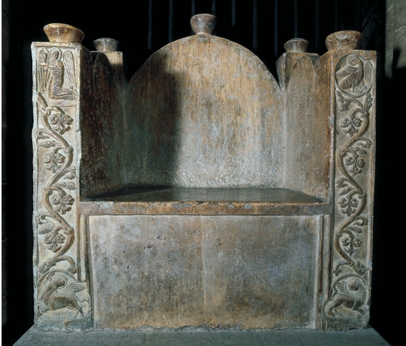
>> Cadeira de Carlemany, feta d'un sol bloc d'alabastre.

rona fou determinant per a les campanyes franques, però va quedar desplaçada per Barcelona, conquerida el 801, amb una posició més estratègica, prop de la nova frontera i al costat del mar.