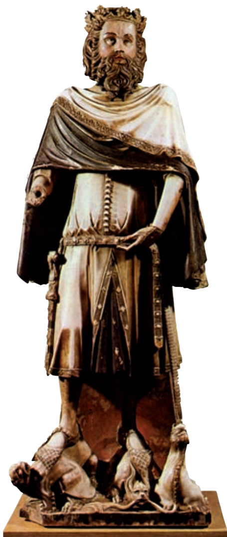
>> Carlemany, escultura gòtica de la catedral de Girona.

L es llegendes són un element de la cultura popular que han estat importants en la transmissió del coneixement en general. Podríem definir la llegenda com un relat que té el seu punt de partida en un esdeveniment històric però que s'amplifica i modifica amb altres materials i dóna com a resultat una narració que té poc a veure amb la història objectiva. La figura de Carlemany és ben coneguda a Girona i al nord de Catalunya, on abunden llegendes de marcat caràcter popular sobre fets que l'emperador va protagonitzar en aquestes terres, però amb un component fantàstic molt accentuat, que les fa poc creïbles als ulls crítics de la contemporaneïtat, en què s'ha tendit a escriure una història objectiva que ha anat desmuntant molts tòpics.