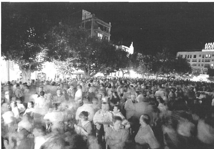
Festa multitudinària d'estiu a Roses.

ANTONIO ESPINO - "ROSES, L'HECICÓ NATURAL"