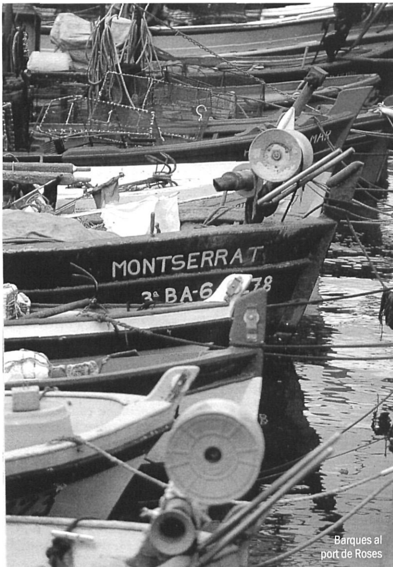
Barques al port de Roses

ANTONIO ESPEJO - "ROSES, L'ELECCIÓ NATURAL"