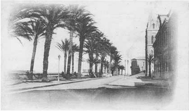
El carrer Barris a La Calle, detall que ens ajuda a valorar el pes de l'empresa gironina.

No era pas, és clar, una formulació independentista, sinó més aviat autonomista; una proposta que bevia dels corrents anticentralistes del federalisme i que advocava per la defensa de la cultura i la llengua catalanes, però que no qüestionava la integració de Catalunya en el conjunt del projecte espanyol. L'Estat espanyol, però, havia posat al descobert la seva incapacitat de defensar els seus interessos, o si més no, els dels fabricants; ja des de la constitució de les primeres Corts de la Restauració els diversos governs no havien estat a l'altura de les seves demandes.