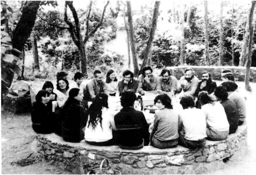
Amb membres de l'Àrea de Cultura de l'Ajuntament, a la font del Ferro de Girona, l'any 1983.

valoracions i per introduir un dels eixos principals de la seva reflexió en aquells moments: la relació escola-territori. Diu així (en la llengua original del text): «Es un hecho que la escuela, en general, vive de espaldas a la realidad que la rodea: la escuela se asemeja a sí misma en todas partes, experimenta una notable dificultad para diversificarse a partir del entorno en que se asienta; la escuela, en fin, está alienada de su territorio, lo ignora.»(5).