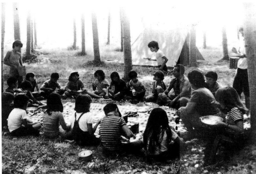
Campanament a l'Armentera, l'estiu de 1983. Experiència relatada a l'obra El lleure com a projecte .