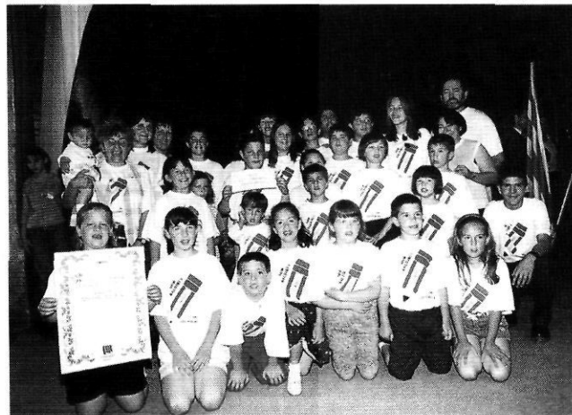
Alumnes guardonats amb el Premi Baldiri Reixac.