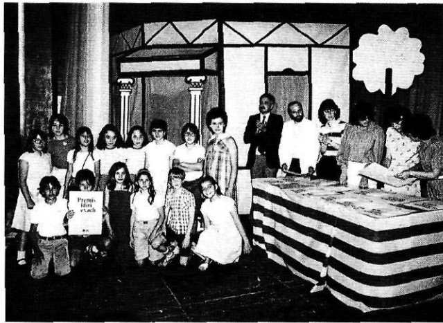
Activitats distingides amb els Premis Baldiri Reixac.