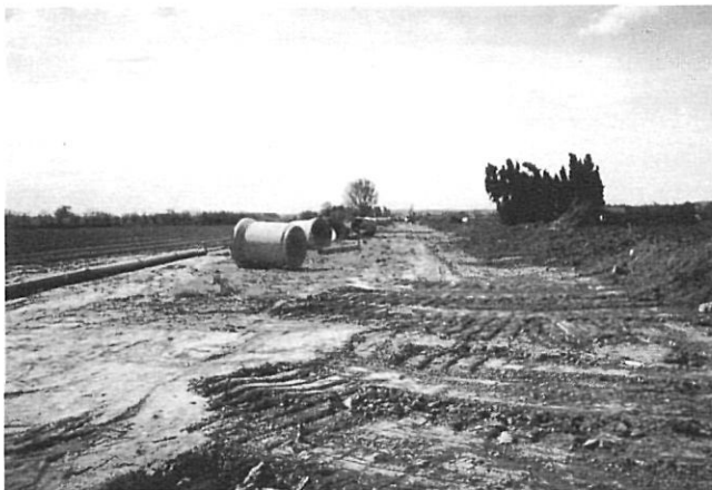
Soterrament del regadiu per millorar el regatge dels camps.

A la zona més baixa de Pals, darrerament s'ha tornat a desenvolupar el conreu de l'arròs; conreu que va arribar a ser molt rellevant durant el segle XIX i la primera meitat del XX. L'arròs va ser durant molts anys l'única font d'ingressos dels habitants de Pals. A partir dels anys 60 aquest conreu va anar minvant fins a ocupar un territori molt petit. A meitat dels anys vuitanta, però, va començar a incrementar-se fins avui, que se'n conreen prop de tres-centes hectàrees. A les terres baixes properes al mar és on té lloc el seu conreu. Aquestes tenen les característiques idònies pel fet que tenen el nivell freàtic alt i l'arròs és un dels pocs conreus que pot suportar una elevada salinitat.