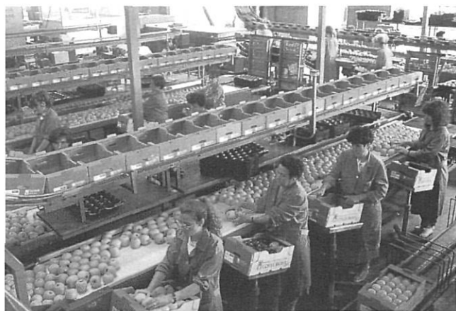
Interior de la Cooperativa Costa Brava (Ullà).

dologia de treball i canviar el concepte de producció per obtenir fruits i bestiar més nets de residus i obtenir fruita i vegetals amb un menor nivell d'aplicació de productes fitosanitaris.