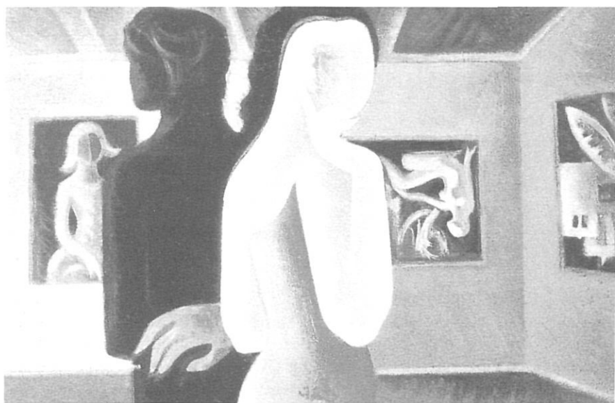
Figures femenines en una exposició de Pep Colomer (1984).

co-popular-socialista dels de baix, no ens atrevim a fer gaires bromes amb els olímpics doctors defensors de l'avantguarda neoplatònica i dels límits de la raó.